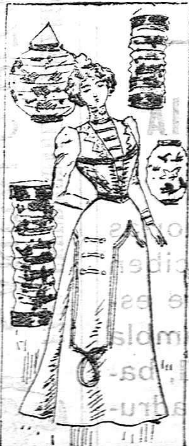
Traje para señorita

Modelos exclusivos para nuestras lectoras de los grandes almacenes de El Siglo, de Barcelona.