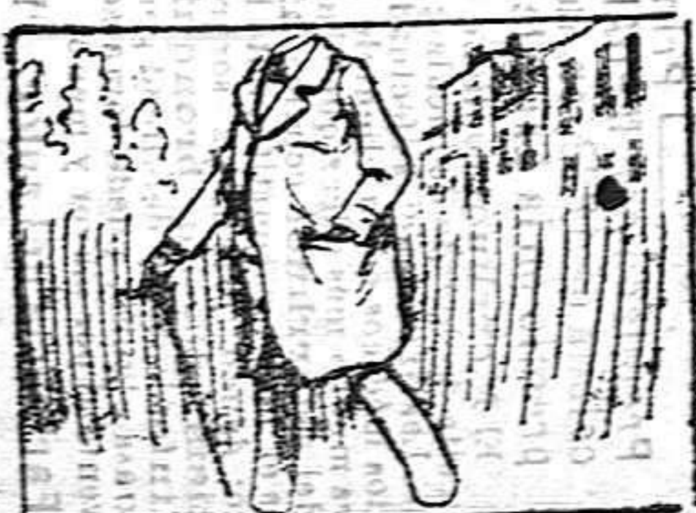
Solución á la charada anterior: Petra.