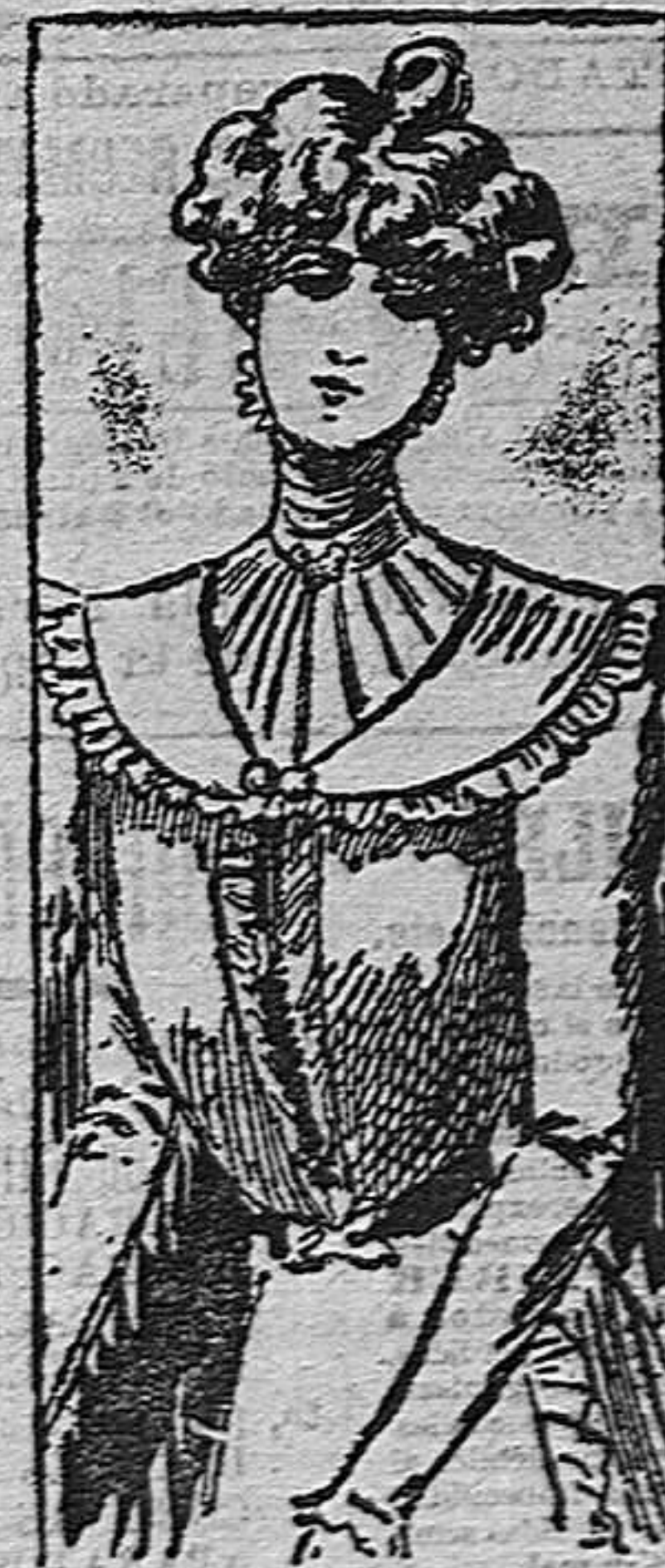
Traje para verano

Confeccionase este traje con batista antracita sobre viso de gasé. Se compone de un cuerpo adornado de entredoses colocados en la forma que indica el dibujo. Mangas ajustadas, con entredoses también en las hombreras y en los puños. Cuello recto con elegante corbata de encaje. Cinturón de cinta y faldas adornadas de entredoses.