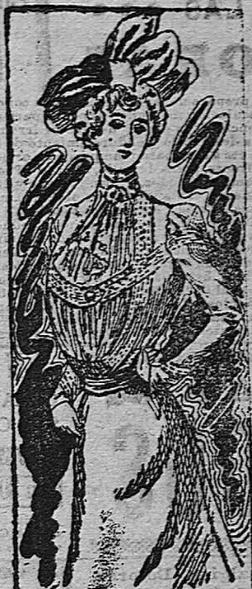
Traje para señorita

Confeccionase este traje con batista antracita sobre viso de gasé. Se compone de un cuerpo adornado de entredoses colocados en la forma que indica el dibujo. Mangas ajustadas, con entredoses también en las hombreras y en los puños. Cuello recto con elegante corbata de encaje. Cinturón de cinta y faldas adornadas de entredoses.