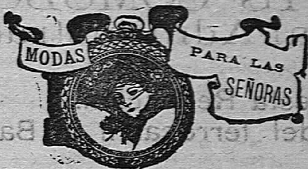
Modelos exclusivos para nuestras lectoras de los grandes almacenes de El Siglo, de Barcelona.