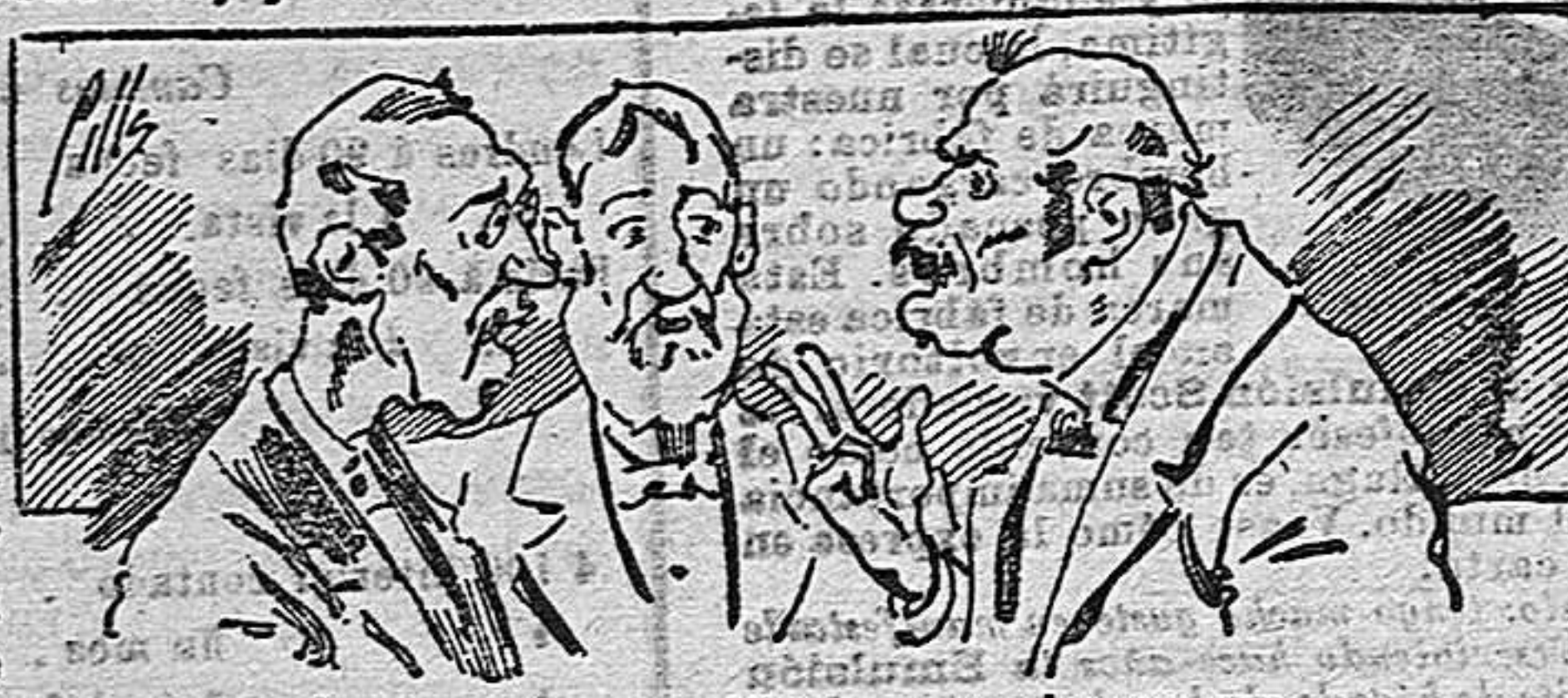
Abominan á nuestros libros... pero los compran.

Todas las personas de gusto, curiosas é ilustradas deben pedir al Director de LA AVISPA, apartado núm. 8, MADRID, un ejemplar que se remite gratis y franqueado. Esta Revista Enciclopédica Popular publica recreaciones científicas, recetas de cocina, repostería, confitería, vinos, licores, pinturas, harnices, betunes y cuantas noticias y conocimientos puedan ser beneficiosos. Cuenta además con buenos grabados, parte literaria excelente; da regalos mensuales á sus lectores con la Lotería Nacional y participaciones en la misma, á cuyo efecto compra todos los sorteos, y en una de las Administraciones más afortunadas por la suerte, billetes enteros. La suscripción y los números que se nos pidan se sirven gratuitamente á correo vuelto y franqueados, con sólo indicar el nombre y dirección del que lo desea en sobre dirigido al Sr. Administrador de