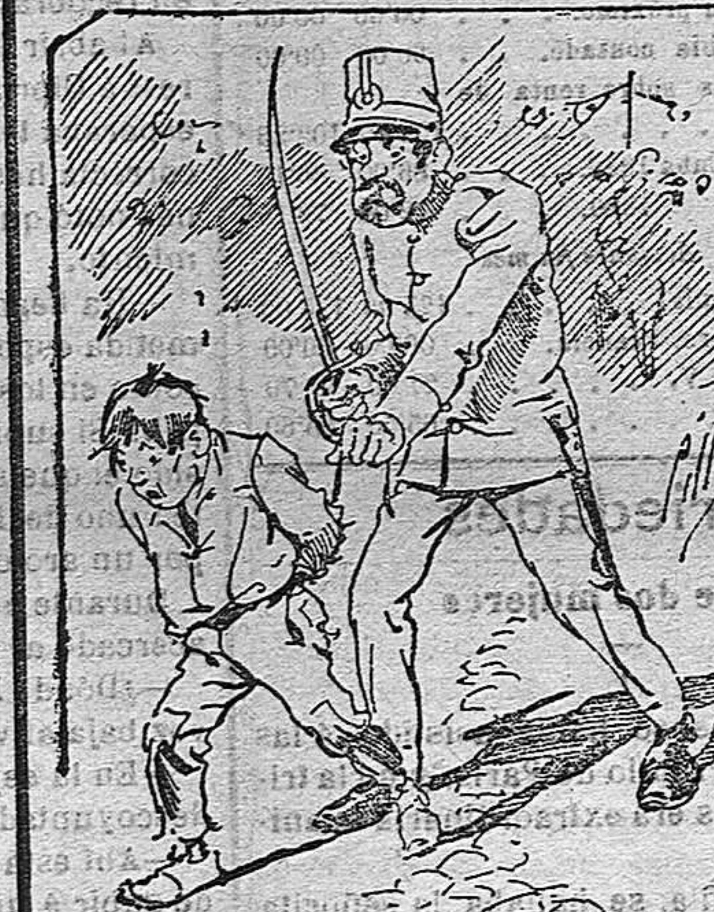
Tratamientos de la policia á nuestros vendedores, cuando el número pica....

También puede pedirse LA AVISPA y el CATALOGO RESERVADO en casa de nuestros corresponsales autorizados, si no se quiere escribir á la Administración