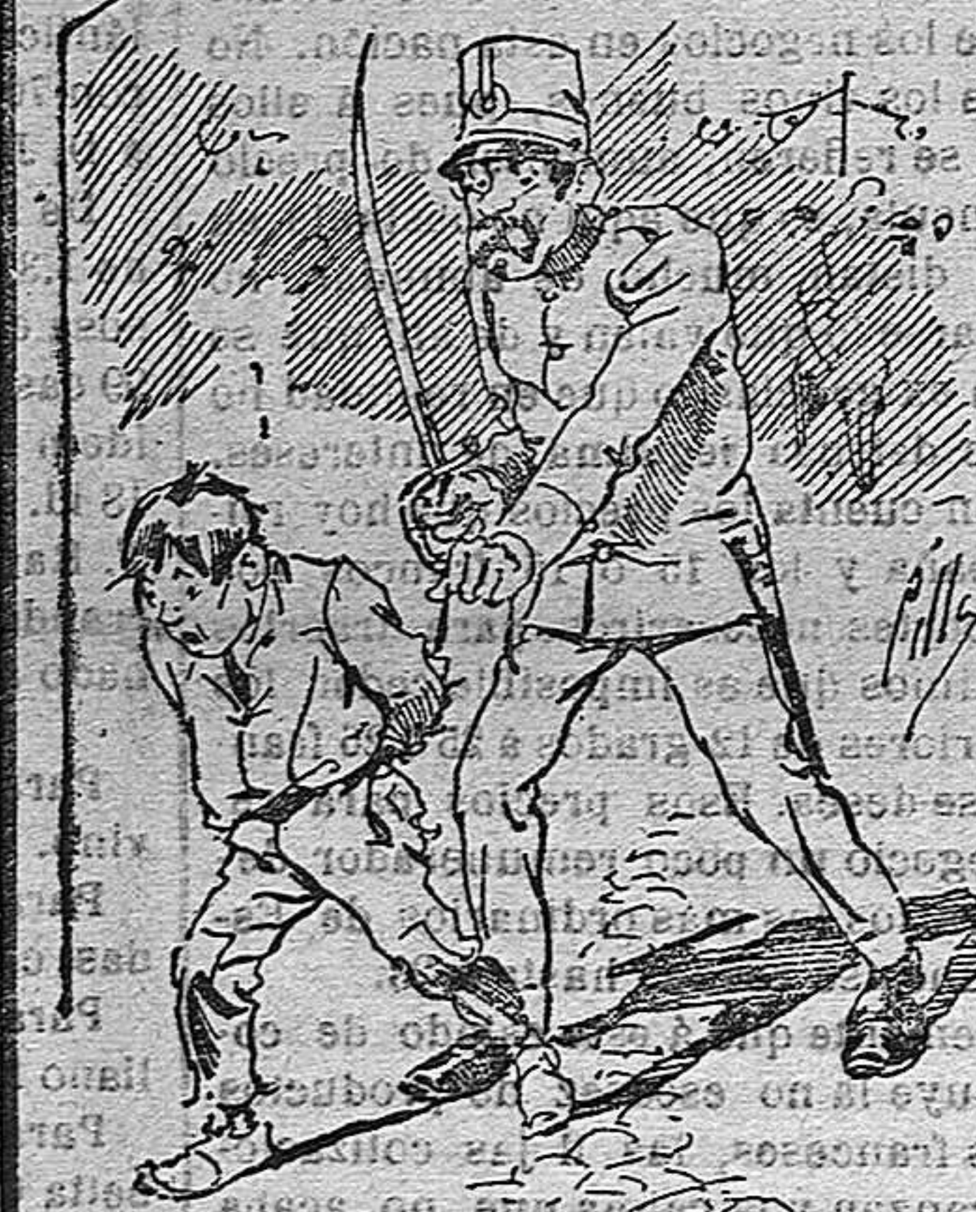
Tratamientos de la polio a nuestros vendedores cuando el número pica...

También puede pedirse LA AVISPA y el CATALOGO RESERVADO en casa de nuestros corresponsales autorizados, si no se quiere escribir a la Administración