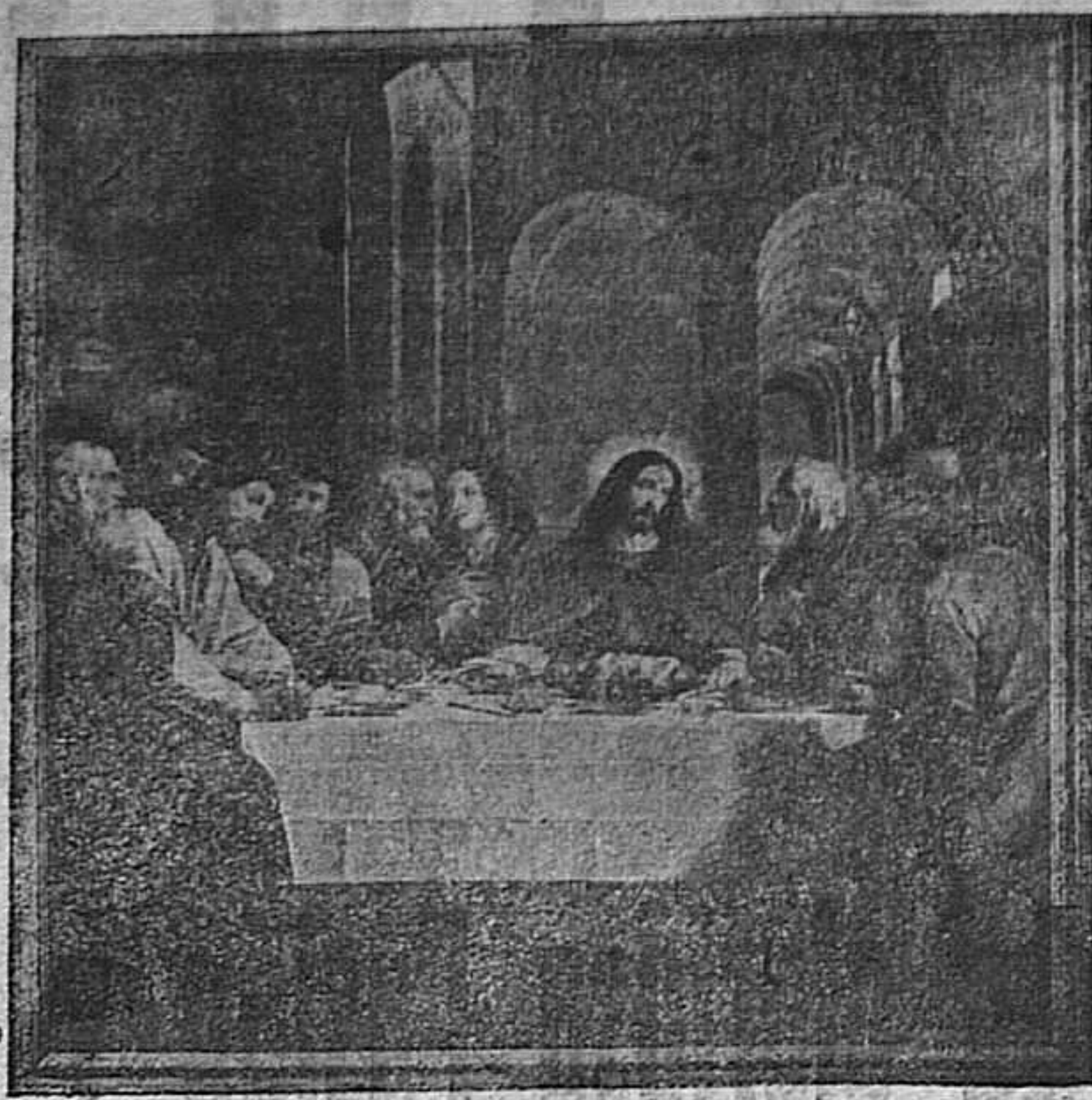
INSTITUCIÓN DE LA EUCARESTIA