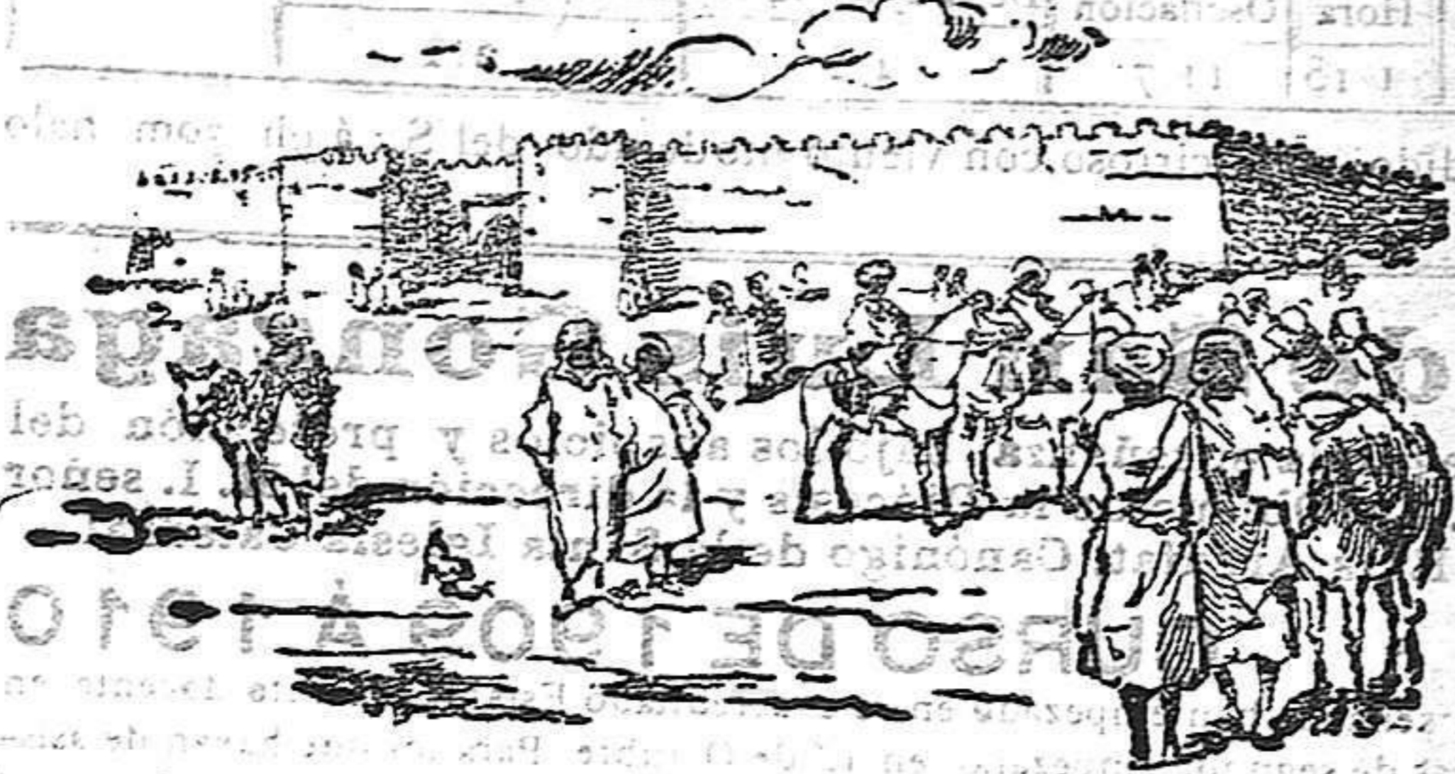
La alcazaba de Zeluán