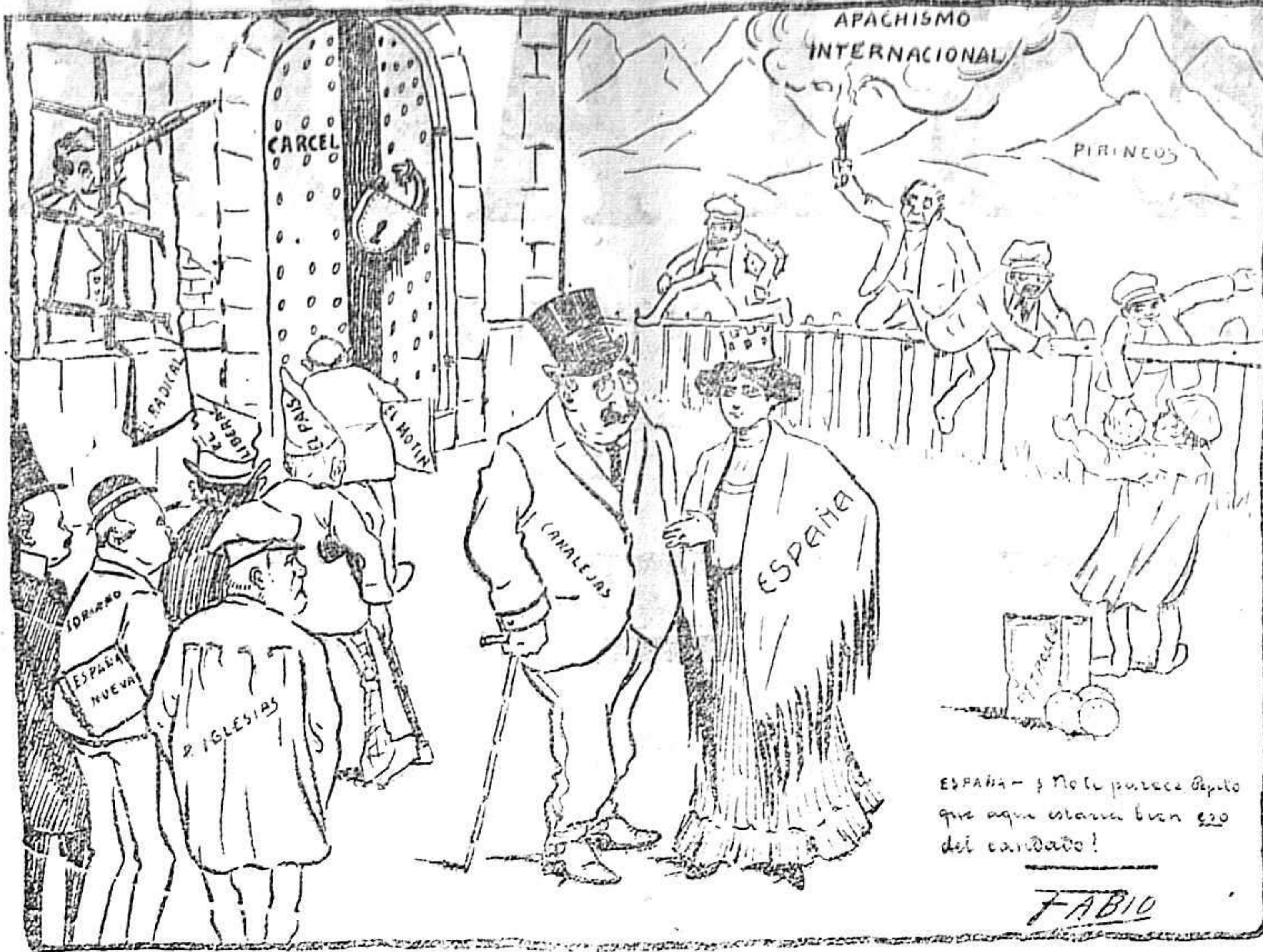
ESPAÑA - ¡Me parece á mí que aquí estamos bien del candidato!

¡Ay, de mi humilde lugar, manso retiro del bien!... ¿Quién pudo hasta ti llegar que así logró envenenar tu alma pura?... Dime, ¿quién?