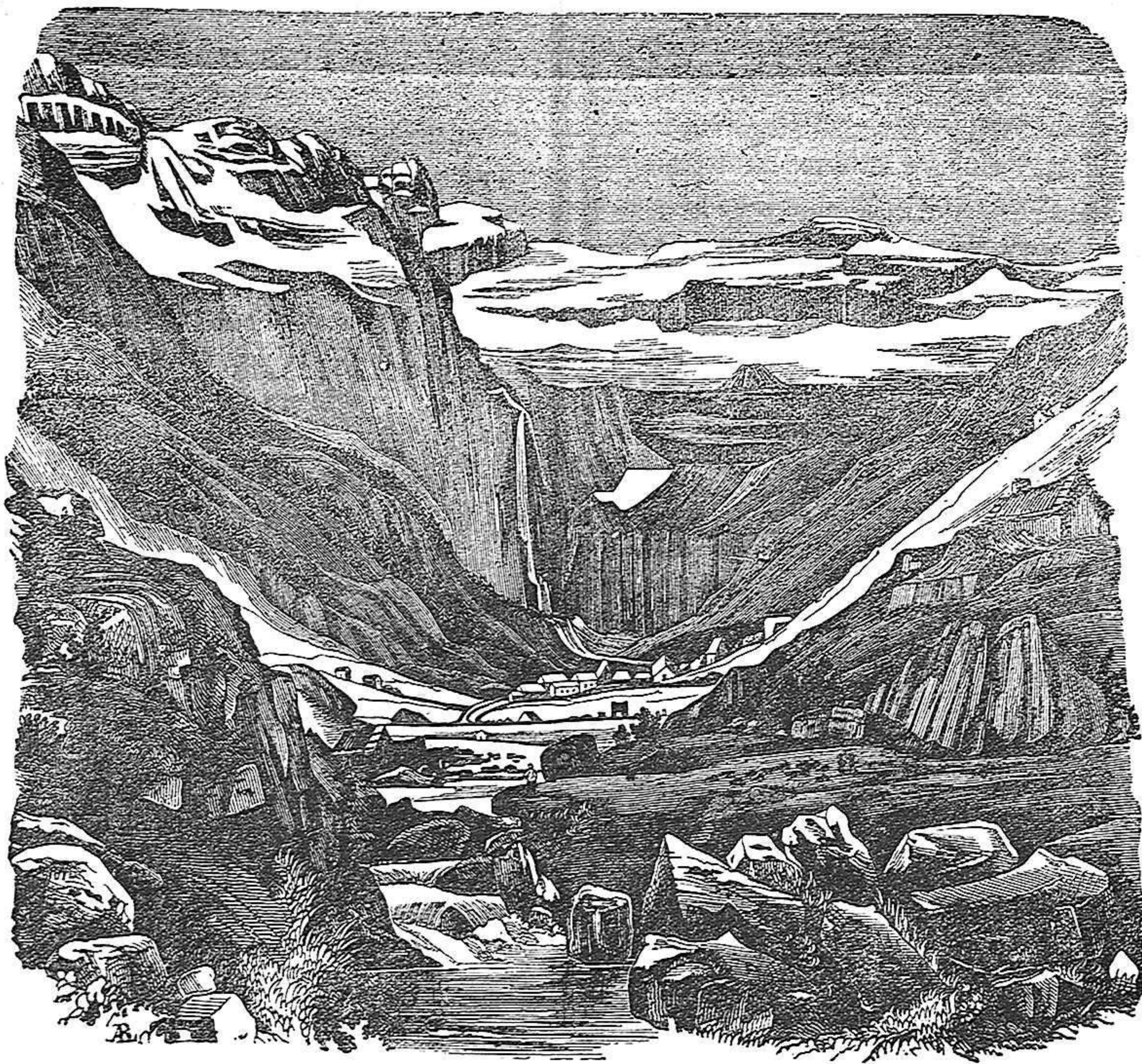
VALLE DE GAYARVE.

su voluntad en un convento, sin justa causa, y el carácter que aparenta tener en el último acto.