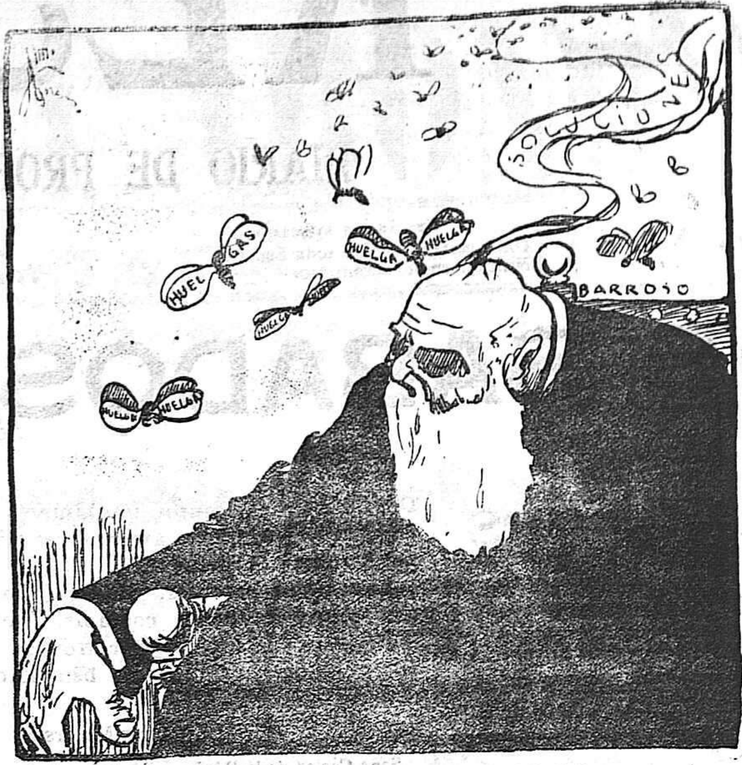
—Nada turba el sueño del más grande de los hombres, nada, nada, nada.