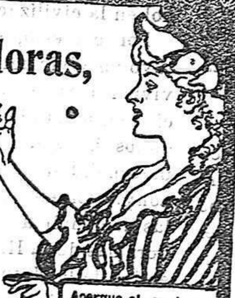
Acerque el grabado a los ojos y verá Vd. la píldora entrar en la boca.

DE VENTA EN LAS BOTICAS DEL MUNDO ENTERO.