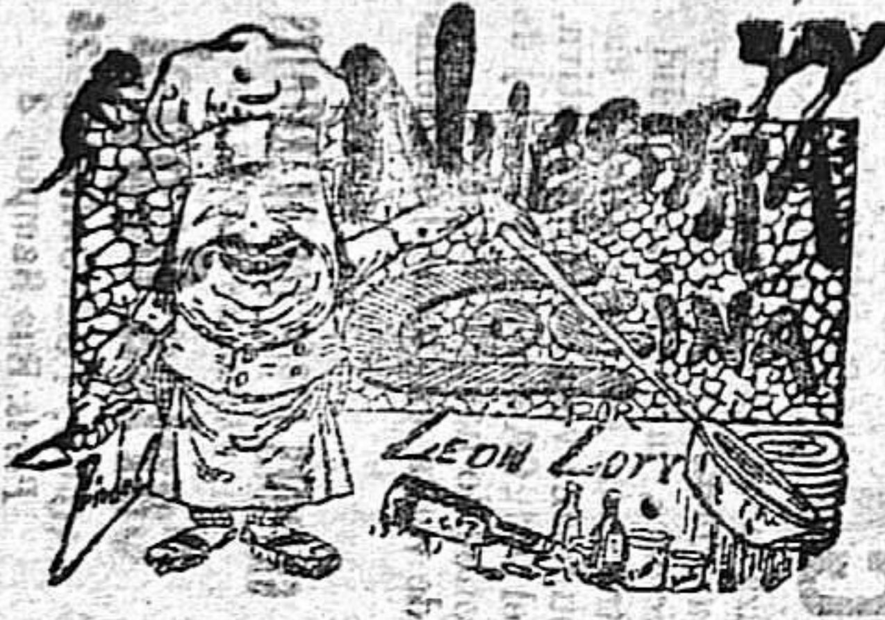
COMIDAS PARA EL 3 DE JUNIO POR LEON LOTY

Almuerzo — Huevos al agridulce. — Bacalao en salsa de ajo. — Cordero á la perigord. — Ensalada. — Postres. — Comidas — Sopa de macarrones. — Ternera á la provenzal. — Judías verdes á la lionesa. — Fritura de pollo. — Ensalada. — Postres. — Cordero á la perigord. — Debidamente preparado y frito en manteca ó aceite, perejil, cebolla, sal y pimienta, se coloca en una cazuela sobre lonjas de jamón y rebanadas de vaca cubriéndolo con jamón y ruedas de limón sin pepitas ni corteza y se deja cocer á fuego lento. Terminada su cocción puede servirse con su propio caldo después de espumado y clarificado. — Fritada de pollo — Luego de cocido en agua y sal, se demenuza y se pone despues de unas horas en un adobo de aceite, cebollas zumo de limón, laurel perejil y pimienta. Se escurre y reboza en pasta de freir colocándolo á un buen fuego en la sartén con manteca amasada. Luego que esté en su puesto, se traslada á una fuente caliente y se sirve.