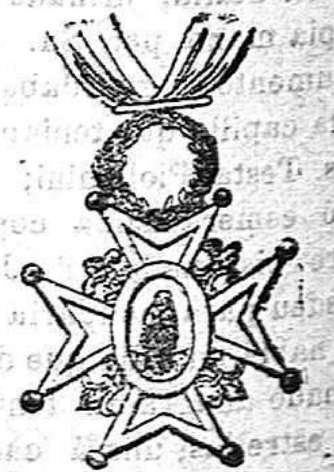
Cruz de Carlos III

La Real y distinguida orden española de Carlos III fué instituida por el monarca de este nombre el 19 de Septiembre de 1771 para celebrar el nacimiento del infante Carlos Clemente, hijo de los príncipes de Asturias. Esta orden fué aprobada por la santidad de Clemente XIV, en su bula dada en Santa Maria la Mayor el 21 de Febrero de 1772.