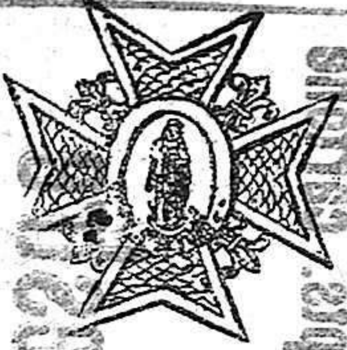
Placa de Carlos III

llos de oro y en el centro de la cruz un óvalo, dentro del cual se ve la imagen de la Concepción, en relieve, vestida de túnica blanca y manto azul. Pende esta cruz de una corona de laurel, de oro, colocada entre las dos puntas del brazo superior, y en lo alto la anilla por donde pasa la cinta.