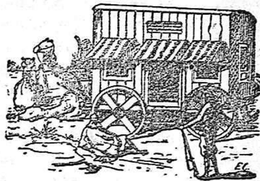
Interior de la tienda

Trabajo larguísimo sería el de detallar las aventuras de Mr. Whiteley durante los veinte años que permaneció en el territorio africano. Sus negros murieron en una cacería de leones. Su esposa fué comida por