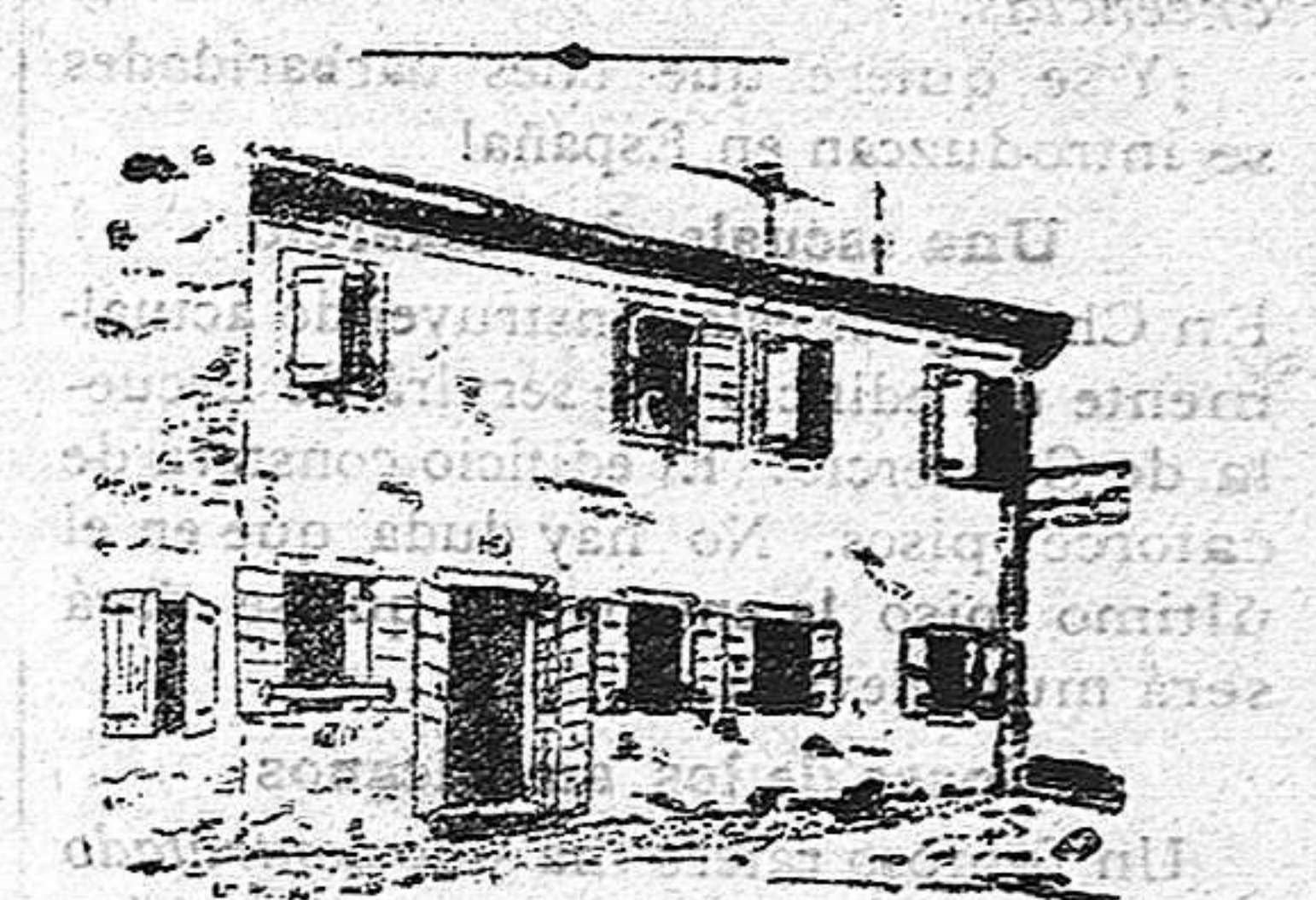
Casa en que nació y vivió S. S. hasta después de celebrar su primera misa.

Cincuenta años han transcurrido desde que en Septiembre de 1858, el que hoy ocupa el solio pontificio, con el nombre de Pio X, celebró su primera misa en la iglesia parroquial de Riese, llenando de legítimo orgullo y alegría á una familia de humildes orígenes.