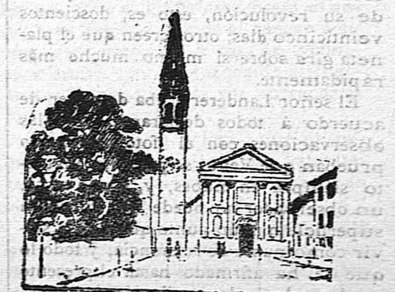
Iglesia parroquial de Riese.

Italia entera, y con ella el orbe católico, celebran con grandes solemnidades religiosas y obras de piedad, el 50º aniversario de tan fausto acontecimiento, y el sucesor de San Pedro recibirá los homenajes de los más poderosos de la tierra, y, lo que para él no será menos estimable, los afectos de sus paisanos y de sus amigos y admiradores de Venecia.