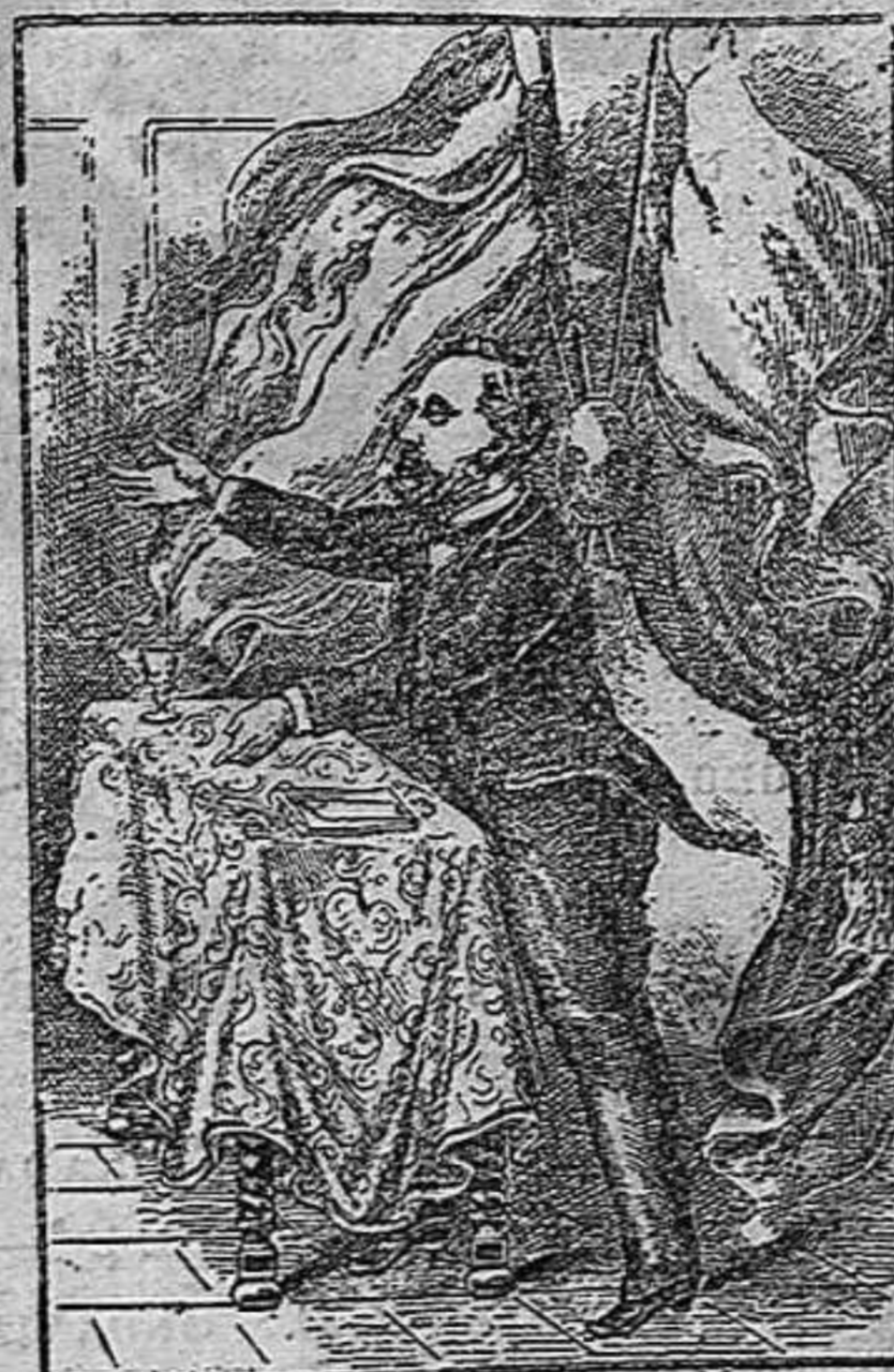
Busquéu, ja la trobareu.