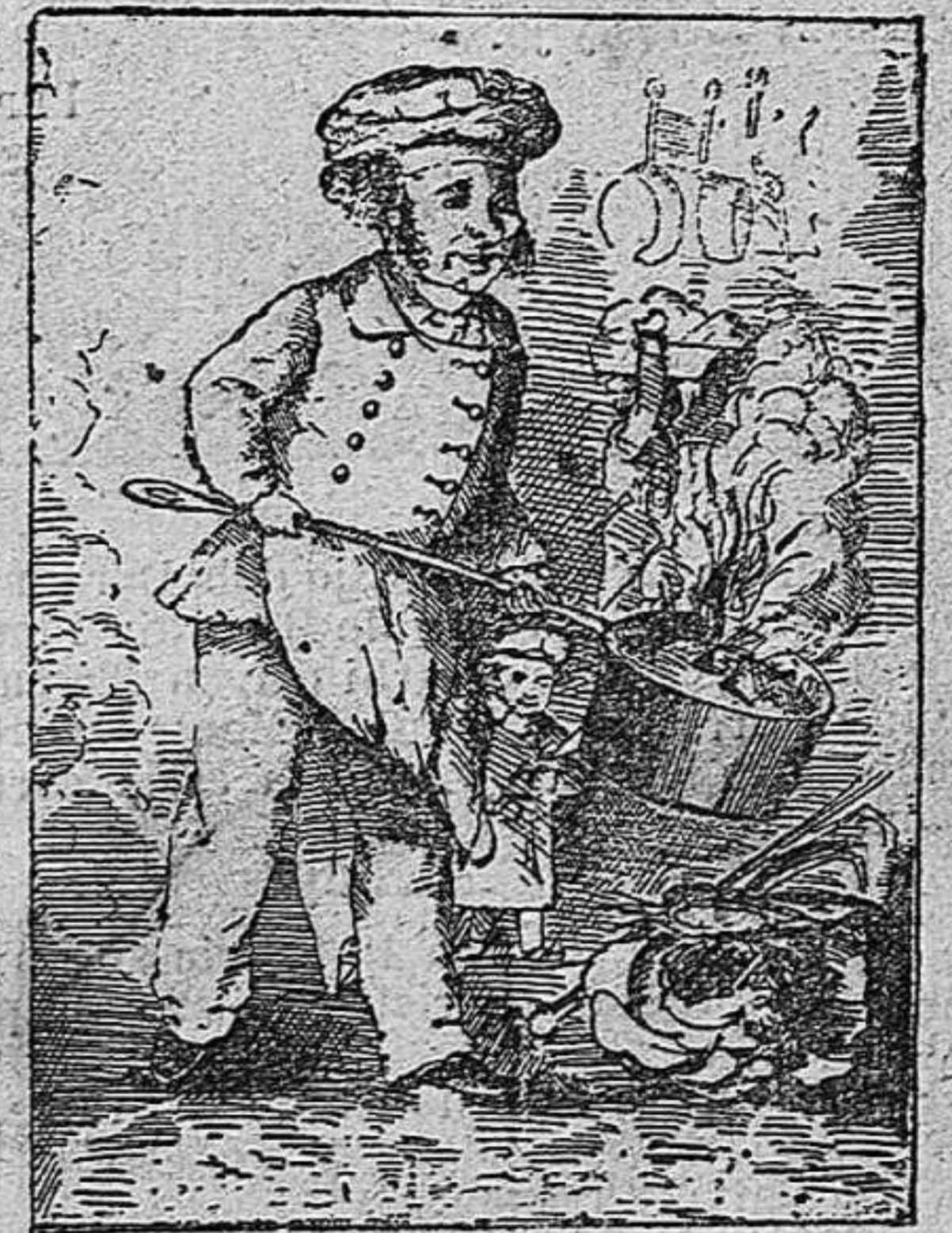
¡Ay, ay! ¿ahont es lo conill?