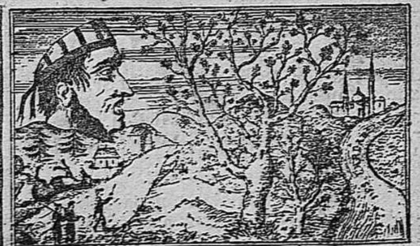
¿Ahont es lo Turch?