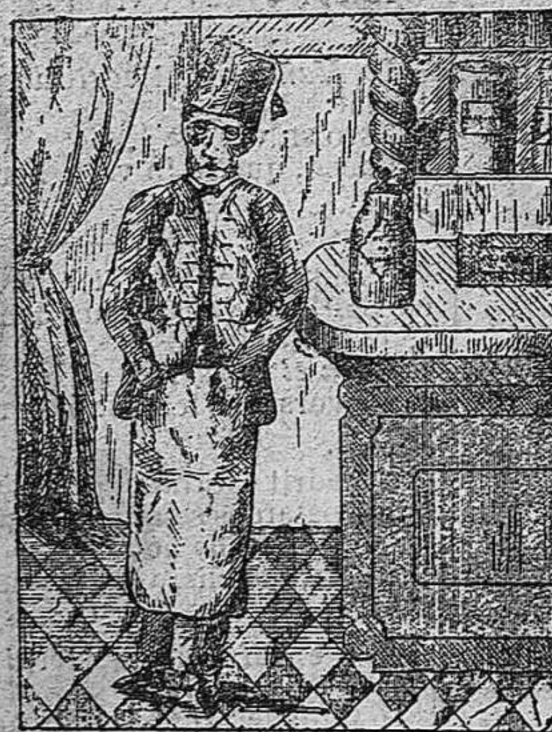
¿Ahont es la xeringa?