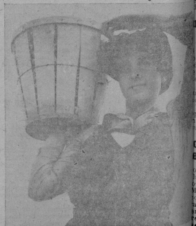
Una muchacha, con el uniforme del Ejército Federal de la Tierra, lleva su cesta llena de judías en una ja del Estado de Maryland, en los EE. UU.