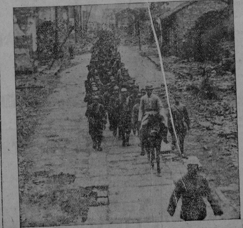
Tropas chinas entrando en Changteh, después de liberar esta ciudad de la provincia de Hunan, de manos de los japoneses