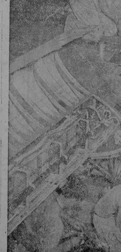
Estos obreros especializados están colocando en su lugar en el ala uno de los cuatro motores del bombardero B-24