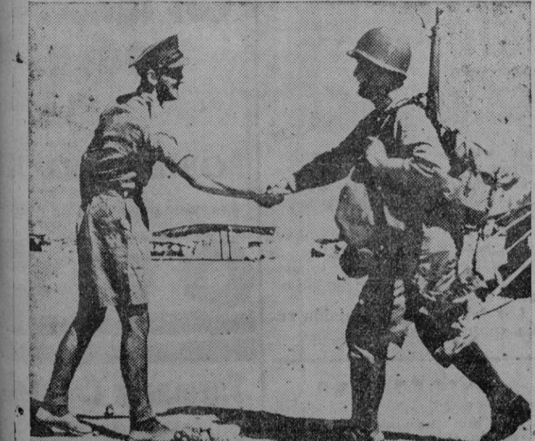
La bienvenida al compañero de armas. — Un soldado inglés saludando a uno americano, perfectamente equipado, a su llegada a una de las bases del Oriente Medio.

Guatemala. — El Gobierno ha decretado que los servicios de comunicaciones, transportes, transportes, energía eléctrica, aguas y hospitales de todo el país se considerarán como servicios auxiliares del ejército y bajo las estrictas ordenanzas militares, contrarrestando así el vasto movimiento dirigido contra varios miembros del Gobierno.