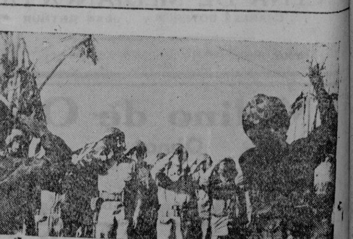
En las Marshall. — Oficiales del Ejército, la Marina y la Infantería de Marina norteamericanos, contemplando como se iza la bandera de los EE. UU. en Eniwetok