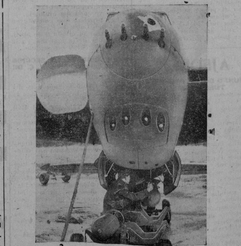
Impresionante aspecto del morro de un avión Mosquito de la RAF que muestra las tres clases de armas que lleva: 4 ametralladoras de 0'303, 4 cañones de 20 mm. y 500 kilos de explosivos