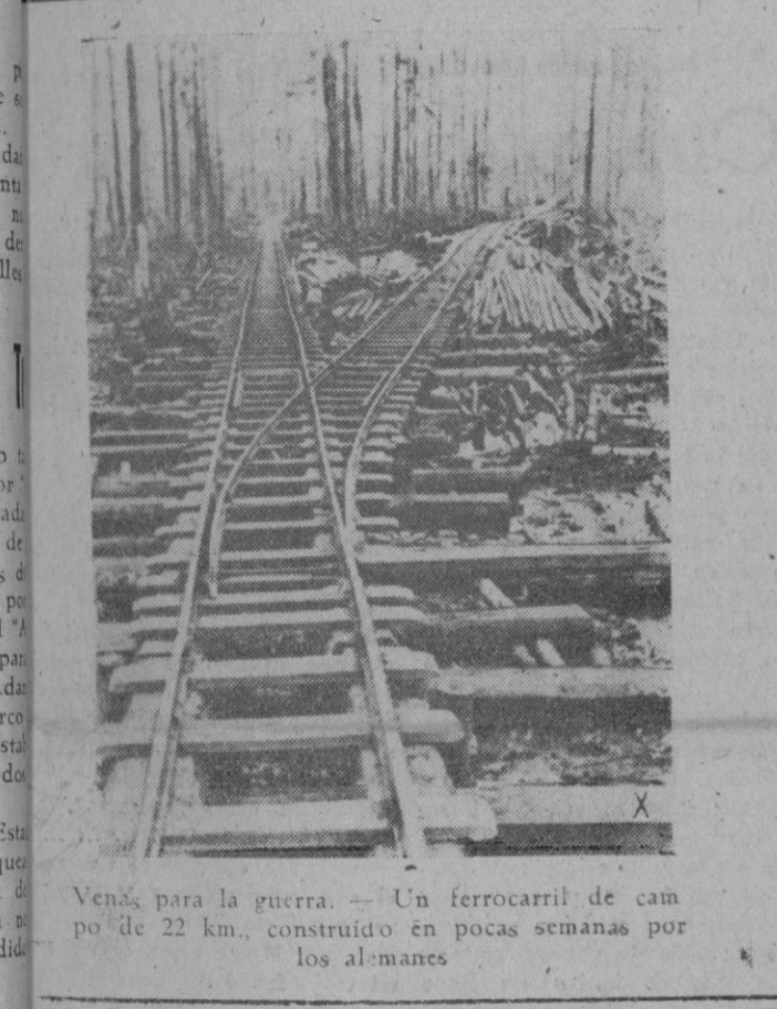
Venas para la guerra. — Un ferrocarril de campo de 22 km., construido en pocas semanas por los alemanes

Washington. — El Presidente Roosevelt y el Presidente Vargas han firmado una declaración conjunta en la que dicen que es intención del Brasil y de los Estados Unidos devolver la tranquilidad en el Atlántico. La declaración añade que esperan que "Africa occidental francesa no vuelva a ser amenazada contra América meridional."