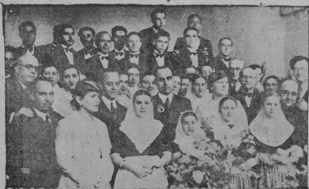
Autoridades, invitados y concertantes en Valldemosa para tributar el VI festival a Chopin

RELOJERIA SUIZA CALLE COLOM, 19 y 21, PALMA