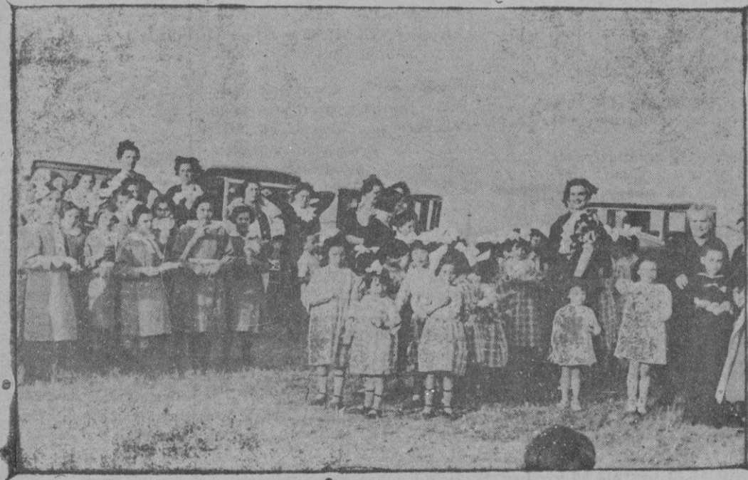
Inauguración del nuevo local de la Cooperativa Taxista. — Grupo de señoritas repartiéndose el almuerzo a los niños asilados