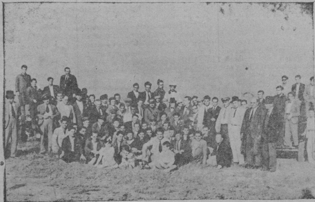
Grupo de autoridades e invitados con los chofers de la Cooperativa Foto Ribas de Durán