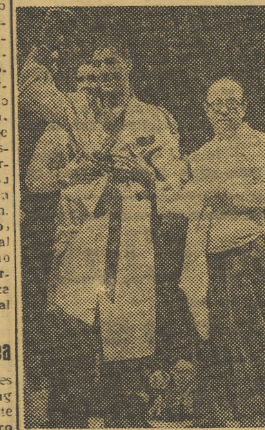
Rocky Marciano, el nuevo campeón

Sexto asalto. — Rocky Marciano queda corto con un golpe de izquierda, tras perseguir a Walcott en torno al cuadrilátero. Walcott coloca un golpe de izquierda y recibe un fuerte derechazo en el mentón. Rocky Marciano acusa a Walcott y le lleva a las cuerdas con un