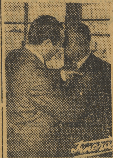
Imposición de la Medalla del Mérito Pugilístico al señor Prieto

Nuestra sincera enhorabuena al secretario de la Federación Levantina y, muy particularmente, a nuestro compañero, cuyo triunfo nos alegra como maestro.