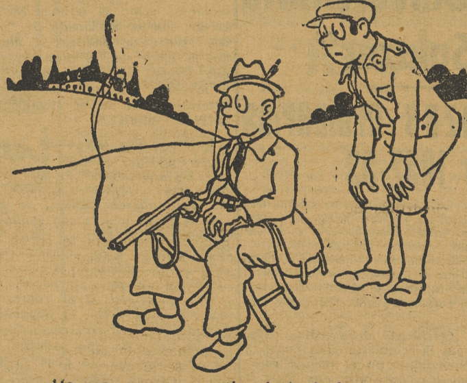
-Me parece que estoy tirando hacia la izquierda. -No, señor marqués. Yo creo que la culpa es del faisán, que se ha puesto demasiado hacia la derecha.