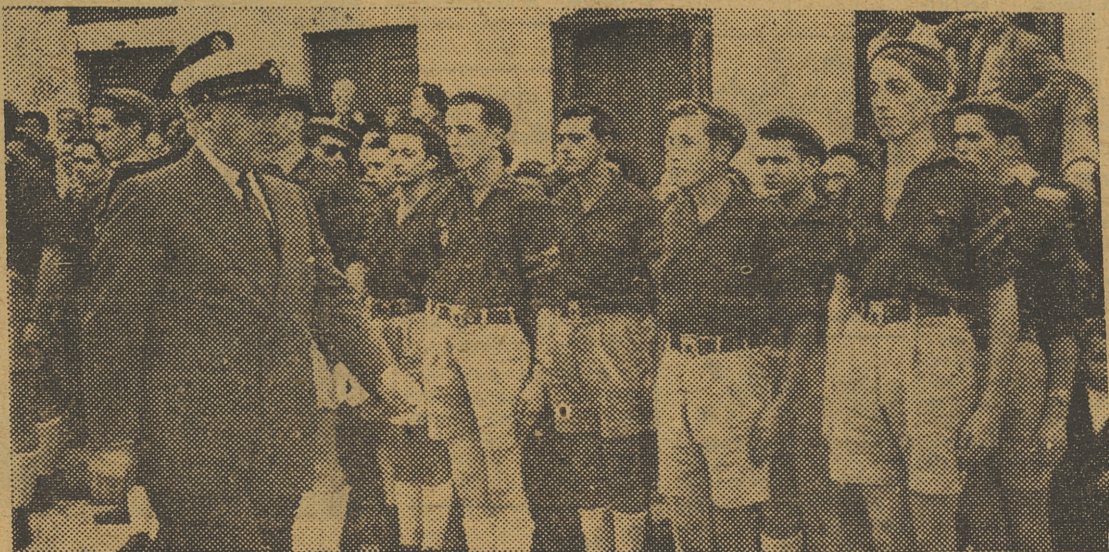
LA CORUÑA. — El Jefe del Estado, Generalísimo Franco, a su llegada a Sada, para inaugurar un hogar del Frente de Juventudes de Galicia