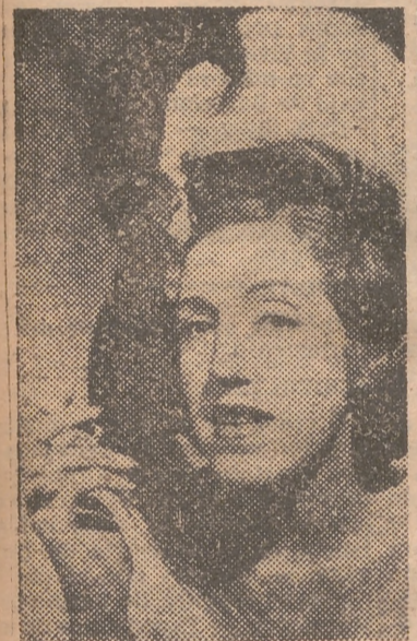
Mary Santpere la artista que acapara la simpatía de todos los públicos, por sus creaciones llenas de humor y de encanto. Su actuación en el teatro Ruzafa constituye un éxito diario

Y para terminar, por hoy, un ruego a nuestros lectores. Pedimos a todos aquellos que, deseando secundarnos, tengan algo que manifestar respecto a la calidad del tabaco, que nos visiten a nos envíen sus opiniones, pruebas y testimonios.