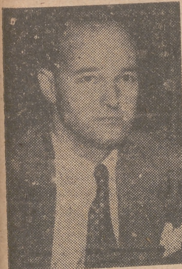
George Kennan, que ha sido designado para desempeñar el cargo de embajador de los Estados Unidos en Moscú

NUEVOS INFORMES Erding (Alemania), 29. — Los cuatro aviadores norteamericanos rescatados contaron esta mañana a los oficiales del Servicio de Información de los Estados Unidos la historia completa de las seis semanas que han pasado en las cárceles comunistas húngaras.