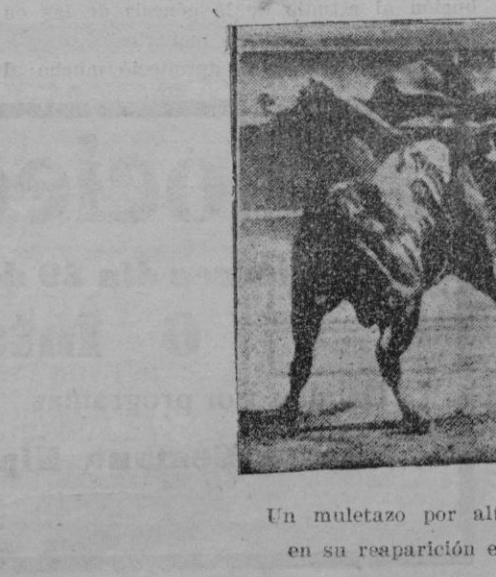
Un muletazo por alto de Juan Belmonte, en su reaparición en el ruedo de Nimes

y la emulación de los ruedos, el torero ha perdido el empaque, el rumbo, el gesto, y lo que vale más: el coraje y la vergüenza. Ahora salen a torear por cálculo, por conveniencia; pocos por afición. El problema no está en que se toree mejor o peor; que el toro sea más chico o más grande; sino en que a la profesión le ha despojado de su atavío más bello, trágico y vistoso: la solemnidad. Los toreros antiguos eran solemnes, y el arte revestía todos los caracteres de un culto.