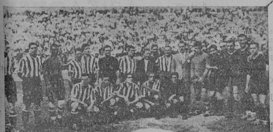
Los equipos del Barcelona y del Athlétic de Bilbao, que jugaron el domingo en Barcelona. — El equipo del Athlétic tiene que jugar el domingo próximo en Palma

La situación era molesta y así, nosotros, dando una prueba de transigencia, acordamos que había que resolver ese problema. La señora Beecher escribió un libro que hizo época, discutimos, nos pegamos incluso, pero al fin se impuso la cordialidad y la benevolencia. Ello sucedió en parte debido a que los cruceros ingleses ahorcaban a los capitanes negreros que sorprendían en el tráfico. Pero, sea como sea, acordamos que viviríamos con mutua libertad de movi-