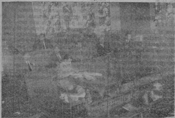
La presidencia de la sesión inaugural de la VI Asamblea Motociclista

A continuación se entró en el orden del día y se adoptaron, entre otros, los siguientes acuerdos: