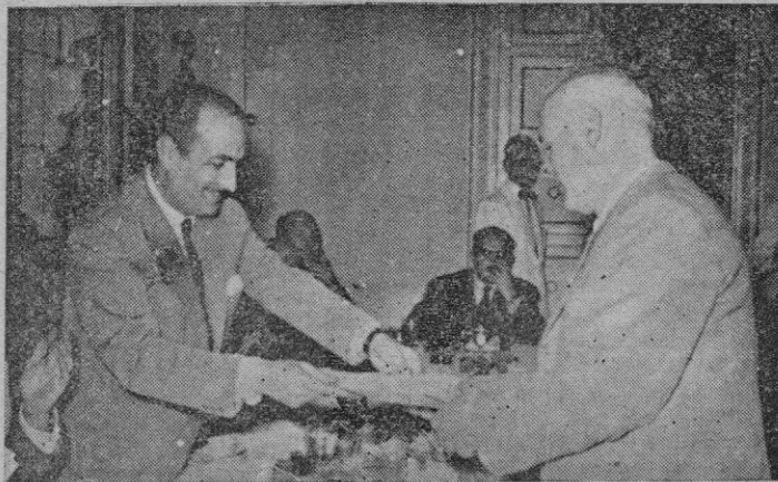
S. E. el Gobernador Civil haciendo entrega del diploma a uno de los obreros más antiguos del ramo de metalurgia.