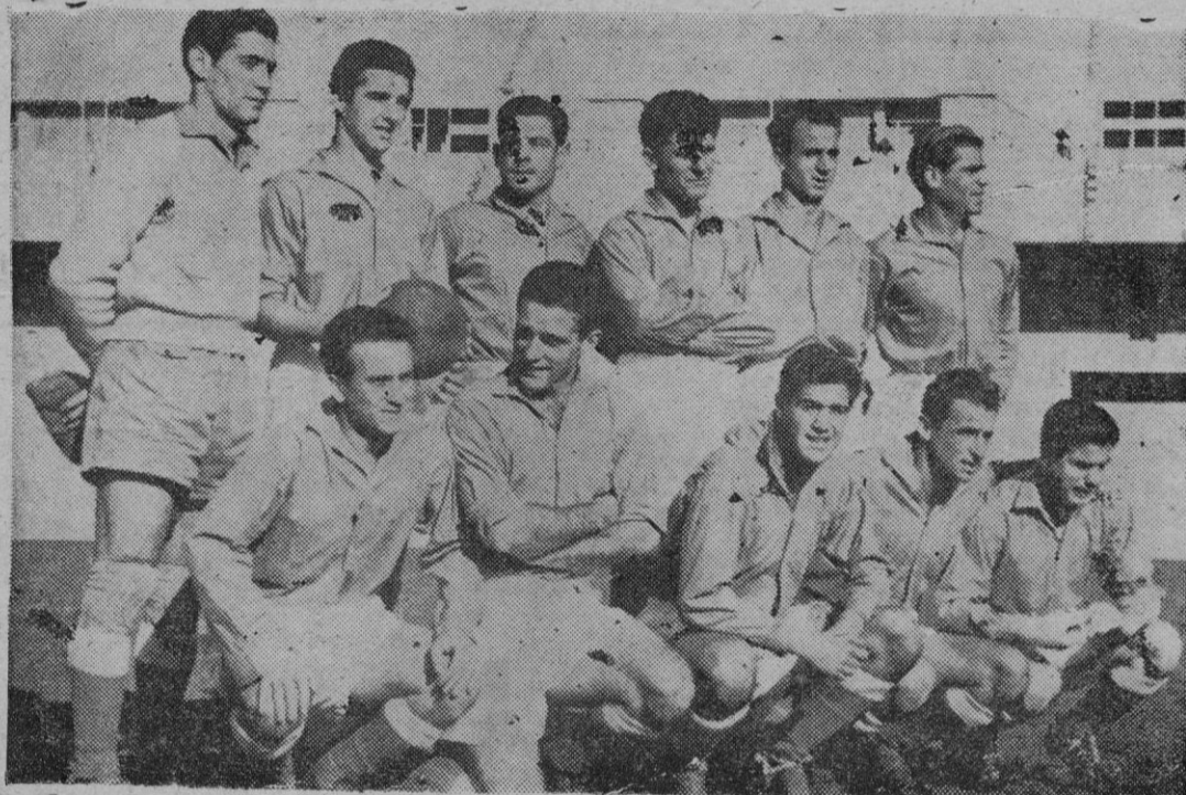
He aquí al equipo que, salvo ligeros cambios, representará a España en el encuentro del venidero día 7 con el de la Argentina