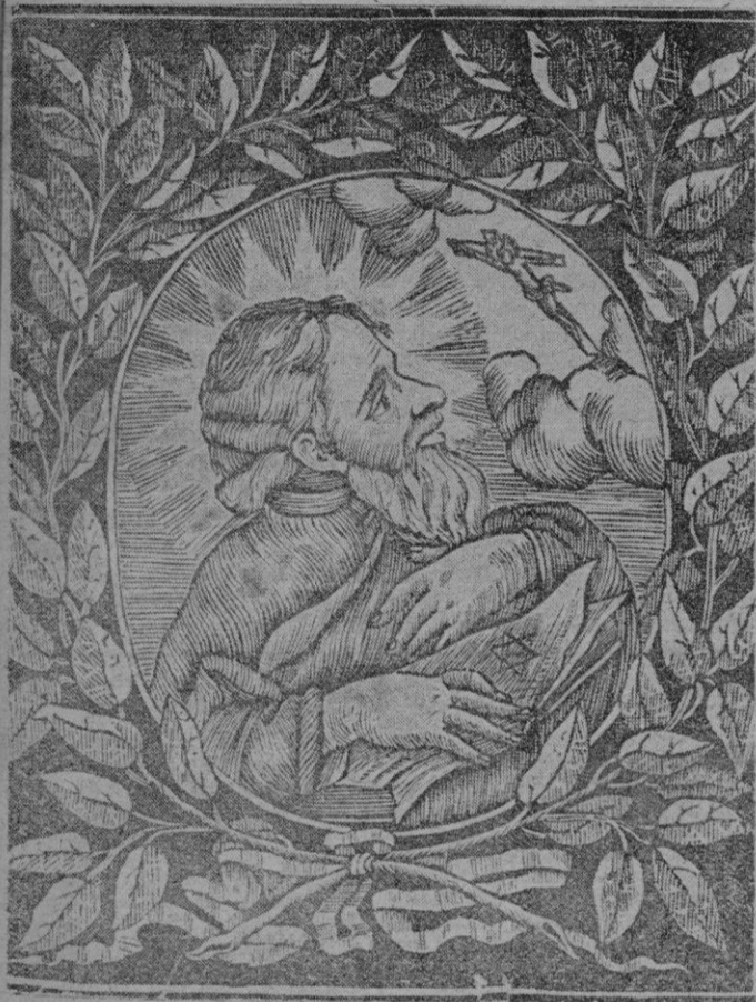
Figura capital en la historia mallorquina es el Beato Ramón Lull, filósofo, teólogo, místico, polígrafo, mejor dicho, en su vida, llena de inquietud, está continuamente al servicio de un gran deseo que viene a ser la forma sustancial de su vida. Porque en Ramón Lull quien domina y campea es el apostolado.

La filosofía luliana no es más que un aspecto de la cruzada para la conversión de los infieles; está, en una palabra, al servicio de la religión y todo su pensamiento se orienta en el sentido de un ideal del triunfo del cristianismo sobre todas las sectas de no creyentes.