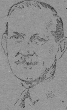
El nuevo Embajador británico en España

Los ilustres viajeros fueron recibidos por el primer intro-