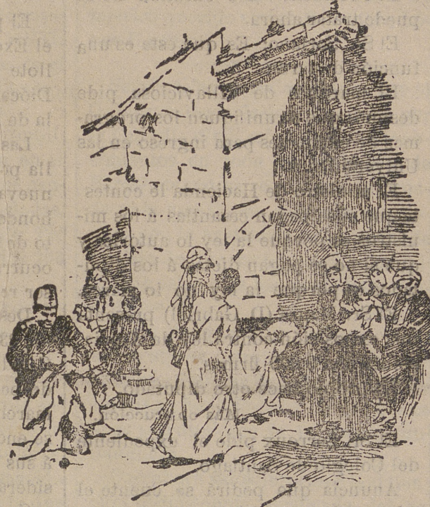
Puerta principal de la Basílica de la Natividad.

A la derecha del coro hay otra escalera que también conduce á la gru-