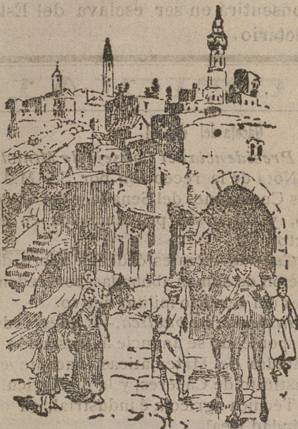
Puerta de Jerusalén.

antiguo átrio de la basílica que la emperatriz Santa Elena mandó construir en el siglo IV, en los lugares del Nacimiento, que dos siglos antes profanó el emperador Adriano haciendo en ellos un bosque dedicado á Adonis y á Venus.