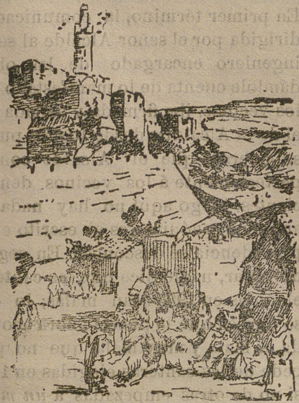
Camino de Belén.

En el camino de Jerusalén á la cuna de la Cristiandad, llano y polvoriento, unas veces, montuoso y quebrado otras y siempre árido, salvo en las cercanías de Betlehem, mil monumentos y lugares nos hablan de infinitas tradiciones ó de hechos registrados en las Sagradas Escrituras, tales como la fortaleza de Sión, cantada en los Salmos; los pozos de Jacob, donde éste fué abandonado; el siniestro valle de Gehene, en el que el dios Molock devoraba niños vivos y crecía el árbol lakoum, que daba por frutos cabezas infernales; el monte del Mal Consejo, en una de cuyas cimas existía la quinta de Caifás donde se decidió la muerte de Jesucristo; el Campo de la Sangre, comprado con el dinero de la traición de Judas, para cementerio de extranjeros; el pozo de los Reyes Magos, en cuyo fondo aun se asegura ver la estrella que los guiaba; el pedregoso Campo de los Barbazos, donde Jesus castigó á un labrador, que al recolectar solo ha-