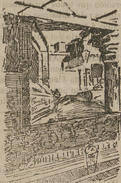
Nicho del pesebre.

Ante el nicho se extiende la habitación de doce metros de ancho por cuatro de largo, con las paredes talladas en marmol blanco, cubiertas en parte por colgaduras de púrpura y oro y con innumerables lámparas pendientes de la bóveda.