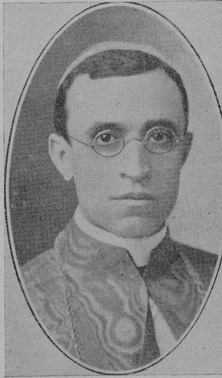
El Cardenal Pacelli, Secretario de Estado del Vaticano, Legado Pontificio en el Congreso Eucarístico Internacional que se inaugura hoy en Budapest

traron nueva escuadrillas en sus aeródromos, dieron orden de movilización y reglamento general y se prolonga inútilmente la guerra en España. ¡Y para qué todo esto! Se dejaría ver la finalidad de la operación trazada por los rojos, de su ofensiva suponiendo que se tratase de una operación de importancia estratégica, ¿cambiaría el rumbo de la guerra? ¿Pero no están viendo que los millares de vidas que sacrifican, el material que concentran, los alardes que quieren realizar, otra nueva ofensiva, no ven que no vale la pena de re-