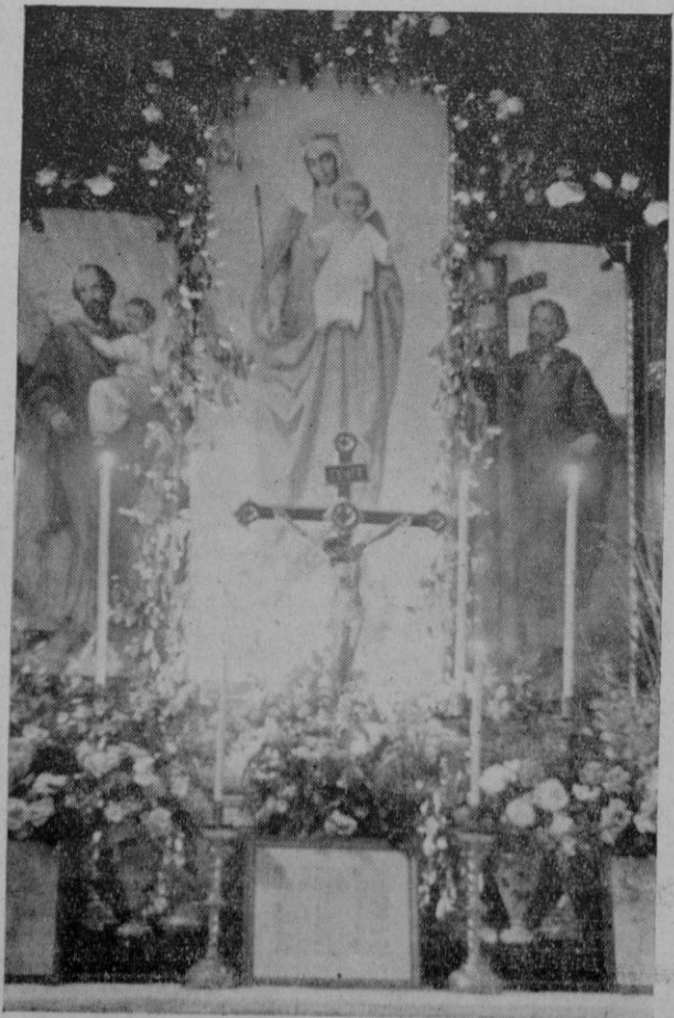
Aspecto que ofrecía el altar de la capilla de la Prisión Provincial, durante la fiesta allí celebrada ayer, dedicada a María Auxiliadora