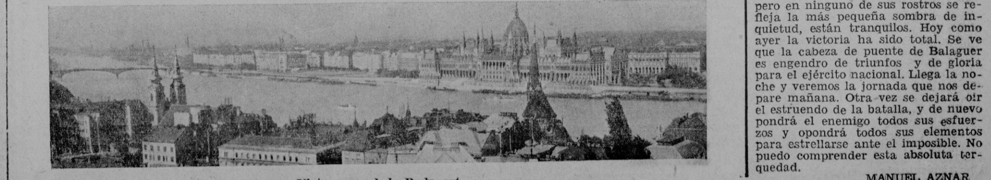
Vista general de Budapest