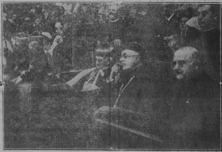
Los prelados que presidieron los actos piadosos del Día Catequístico Interdiocesano, en Montserrat.

Hay cuatro vías férreas y una carretera.