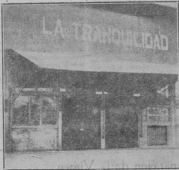
Barcelona. — El café-bar “La Tranquilidad”, situado en el Paralelo, en el que la policía detuvo a 35 individuos y que ha sido clausurado por orden gubernativa.

blo, sea cual fuere el régimen que gobierne la Nación.