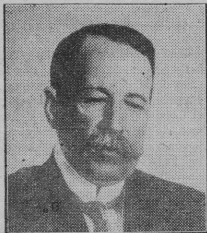
Buenos Aires. — El ex presidente de la República Argentina, señor Figuerola-Alcorta, que ha fallecido, recientemente en esta capital.