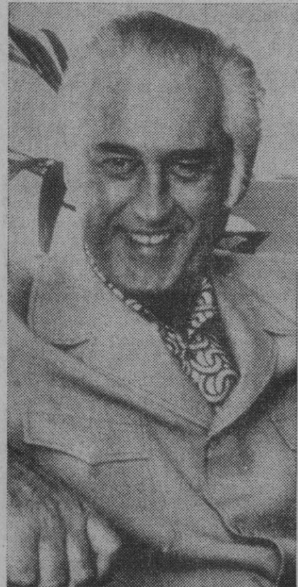
Stewart Granger, un ídolo de hace treinta años. Casi una reliquia. Junto con Clark Gable y John Wayne, pertenece al grupo de los «actores sin edad». Ahora, acaba de rodar una serie de «western» para Hollywood. A sus 58 años se conserva bien, pero sin tratamiento alguno. Dice que come de todo, bebe, se pasa las noches bailando y no hace ejercicio alguno.