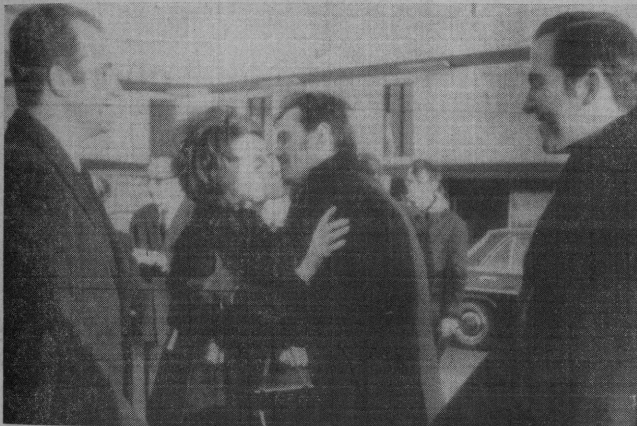
Copenhague.—La Princesa Sofía saludando al príncipe Henrik en presencia del Rey Constantino y el Príncipe Juan Carlos, durante su estancia en Copenhague donde llegaron para una corta visita y expresar su pésame a la familia real danesa.