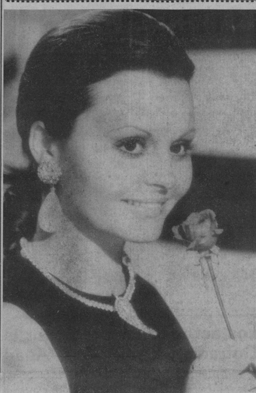
Ha salido al mercado discográfico español un nuevo «single» de Rocío Dúrcal. Lleva los títulos de «Homenaje a Agustín Lara» y «Otel», respectivamente. Según los críticos, ambas canciones son inmejorables. Nos alegramos de este nuevo éxito de la guapa Rocío.

El portavoz de la Embajada norteamericana declaró que el embajador y su esposa regresaban de una cena, a medianoche en Teherán, el 30 de noviembre pasado cuando su automóvil fue bloqueado por otros dos coches. "El embajador se dio cuenta de que los ocupantes de los otros automóviles iban armados y trataban de secuestrarle, por lo que ordenó al conductor que siguiera adelante y pudo escapar de la emboscada", dijo el portavoz.—Efe-Reuters.