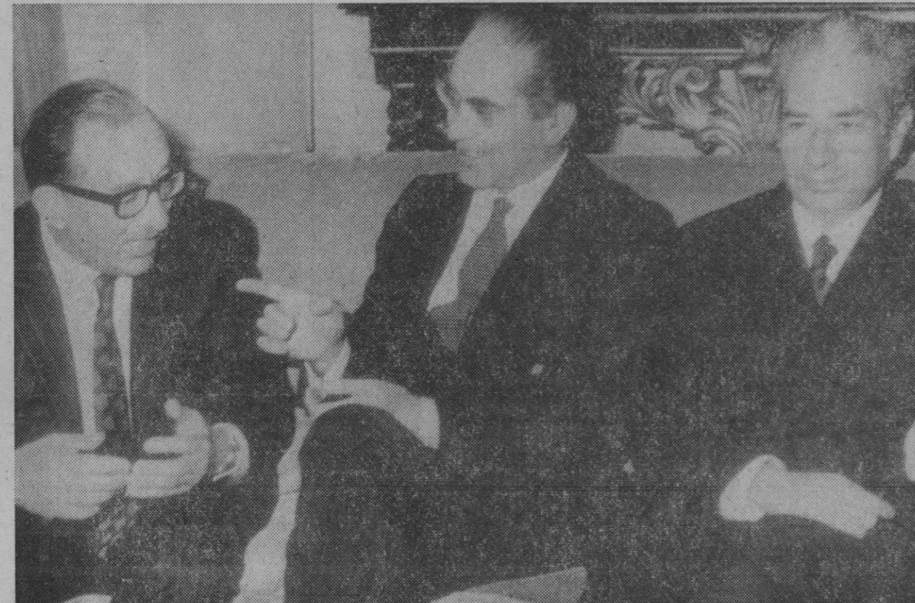
Roma.—El primer ministro de Malta, Dom Mintoff, durante su entrevista con el premier italiano, Colombo, y el ministro de Asuntos Exteriores, Moro. Mintoff se entrevistará en Roma con el ministro de Defensa británico lord Carrington y altas personalidades italianas.

En el mismo vuelo viajaban el presidente de «Iberia», don Jesús Romeo Gorría, y altos directivos de la Compañía española.—Cifra.