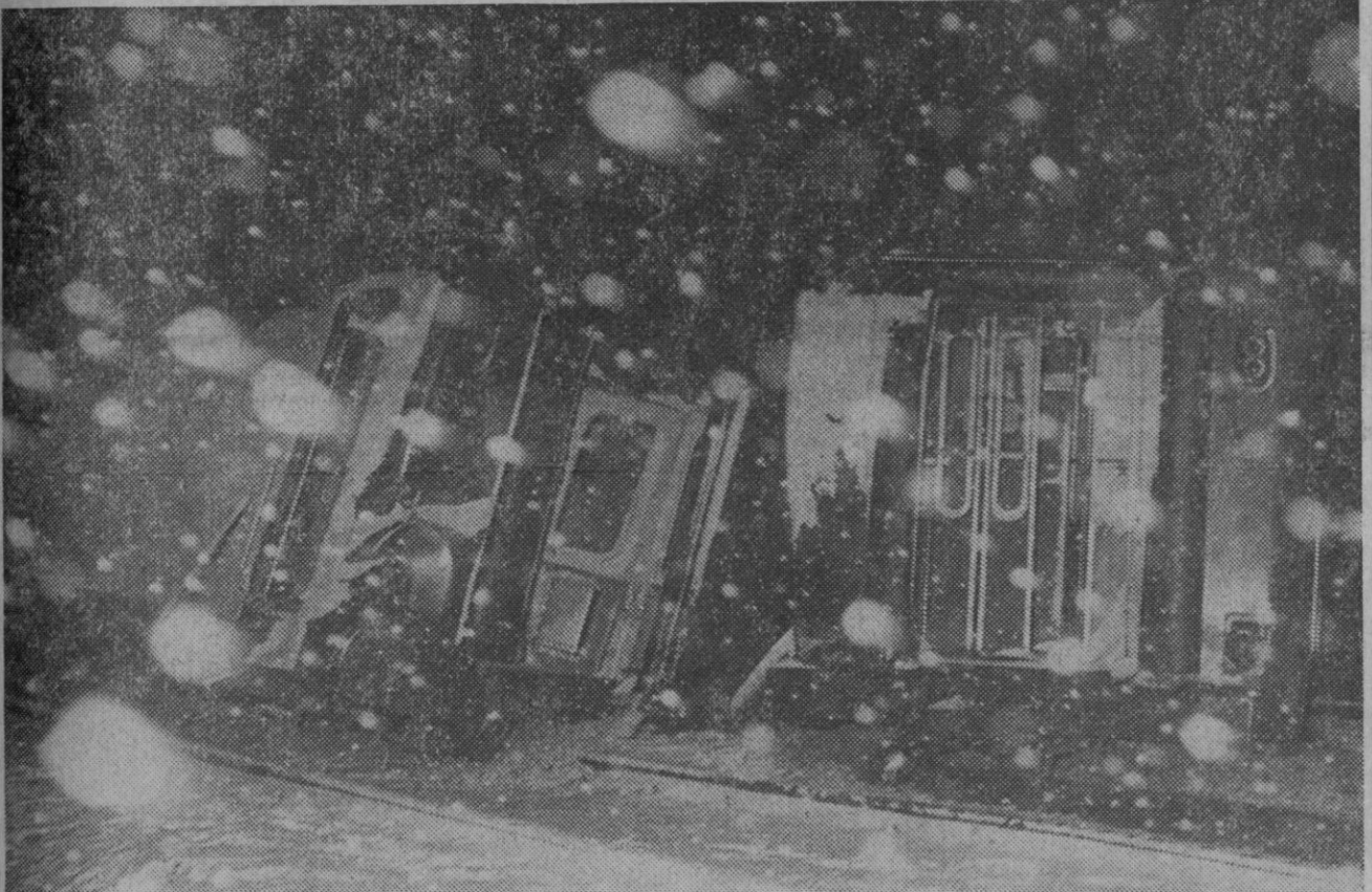
Como informamos en la sección de local, en la tarde de ayer, en medio de una copiosa nevada, las cinco últimas unidades del expreso Irún-Madrid se salieron de la vía, cerca de Campo de San Pedro. Dos personas resultaron muertas y otras treinta y una heridas en el descarrilamiento. En la foto un aspecto del accidente y de las dificultades atmosféricas para el rescate.

Se han superado ampliamente los trescientos millones de pesetas de ventas contratadas durante el primer salón de «Iberpiel», y entre los visitantes compradores han figurado: Alemania, Estados Unidos, Holanda Sudáfrica, Francia, Austria, Portugal, Canadá, Japón, Venezuela, Marruecos, Dinamarca, Bélgica, Italia, Líbano, Andorra, Puerto Rico y Gran Bretaña.