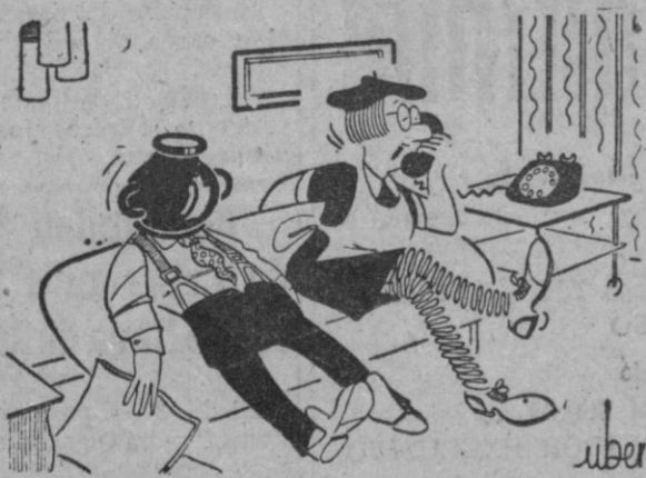
—¡Oiga! Ahora ya le escucho bien, diga...

Hogar feliz hogar con AGNI Cocinas butano de venta en Casa Solera