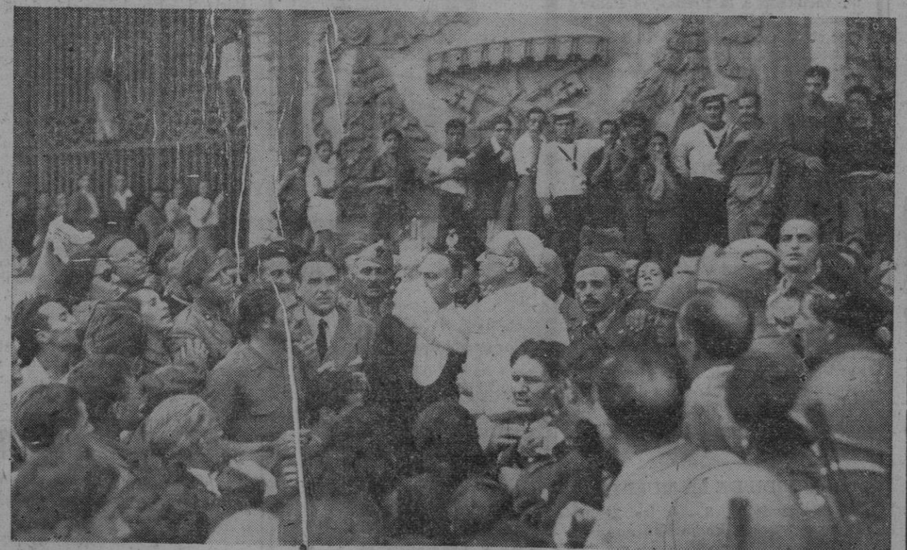
Pío XII, que tantos llamamientos hizo en pro de la paz, sale del Vaticano al cesar uno de los bombardeos de la Ciudad Eterna, para llevar el consuelo a los sufridos habitantes y familiares de las víctimas

tes tuvo buena parte el mariscal Hindenburg, admirador del nuncio, monseñor Pacelli, y de sus altísimas calidades espirituales.