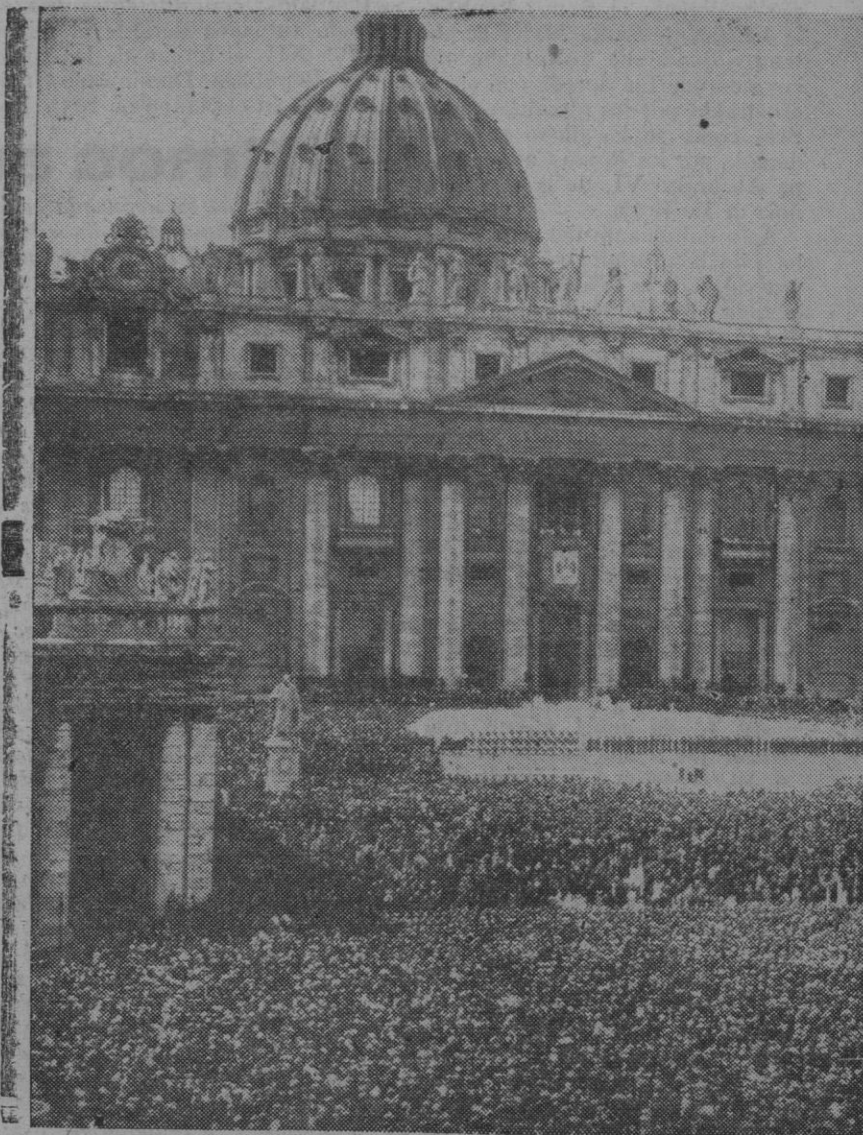
La multitud aclama al Papa Pío XII quien, con ocasión del Año Santo, dirige la palabra a los fieles congregados en la plaza de San Pedro

En la Nochebuena de aquel mismo año, Pío XII, en una alocución al Sacro Colegio de cardenales, presentó