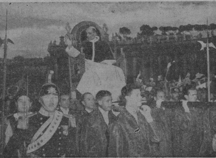
Su Santidad en la silla gestatoria saludando, como siempre, con todo afecto a la multitud que le aclama

LAS CONDICIONES DE SALUD DEL PADRE SANTO HABIAN IDO «AGRAVANDOSE PROGRESIVAMENTE, SIN QUE HAYAN DADO RESULTADO LOS ENERGETICOS REMEDIOS SUMINISTRADOS AL AUGUSTO ENFERMO». DESPUES DE MEDIODIA SE LE HABIA PRODUCIDO A SU SANTIDAD UN «GRAVE COLAPSO CARDIOPULMONAR».