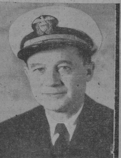
El almirante Harry D. Felt, jefe de la Flota norteamericana en el Pacífico que recientemente ha celebrado entrevistas con el mariscal Chiang Kai Chek, para tratar de la situación militar en torno a Formosa

El texto íntegro del discurso que hoy habría de pronunciar antes los especialistas de cirugía plástica que celebran un congreso en Roma, será publicado, según la costumbre del Vaticano, mañana domingo o el próximo lunes.—Efe.