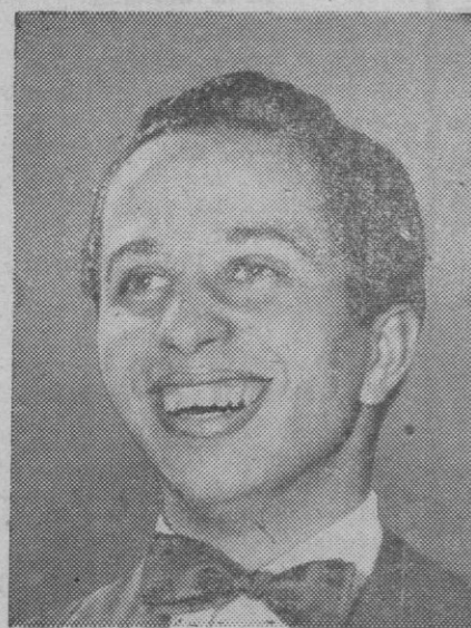
El Rey Faisal del Irak, que mantuvo en su país la bandera occidental y cuya muerte, en las primeras horas de la revolución que lo destronó, parece al fin confirmada