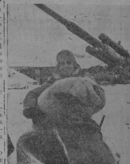
Nada de cariño, como no sea cariño que mata... Este soldado ha logrado atrapar al pobre bicho, "perdido" entre los cañones y le abraza con orgullo, pensando en el banquete de toda la batería de que él forma parte

En un largo editorial dice el citado periódico: «La historia del pueblo dominicano ha estado íntimamente ligada a la expansión del cristianismo en el Nuevo Mundo, desde que Cristóbal Colón colocó la cruz de Cristo en la isla.»—Efe.