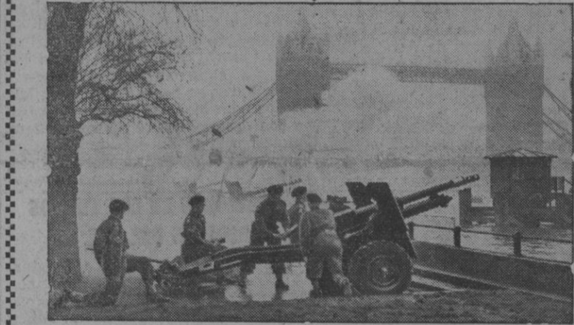
No, no teman ustedes; que no es la guerra en pleno corazón de Londres. Tal sensacional noticia no ha llegado todavía, ni quiera Dios que llegue nunca. Simplemente, sabías junto al puente de la Torre en la capital inglesa, en una de sus fiestas nacionales

*** Noticias de las restantes capitales de España dan cuenta de haberse celebrado con extraordinaria solemnidad la festividad eminentemente eucarística del Corpus Christi, presidiendo todos los actos celebrado un extraordinario fervor y religiosidad.