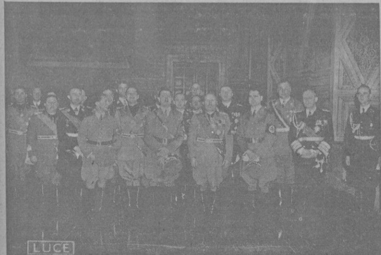
Coloquio en el Palacio Venecia