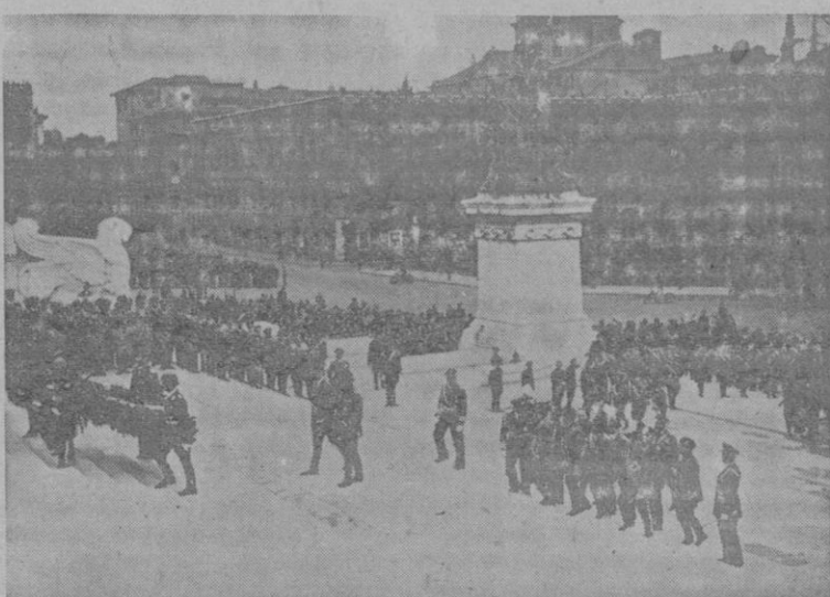
La visita a la Tumba del Soldado Desconocido