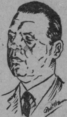
El Presidente electo de la Argentina, coronel Perón

Al elegir al coronel Perón, la gran nación Suramericana ha demostrado de manera inequívoca sus firmes deseos de soberanía, su independencia a toda prueba y sus magníficas aptitudes para cooperar en la obra del restablecimiento de una paz duradera con el concurso de todos los pueblos.