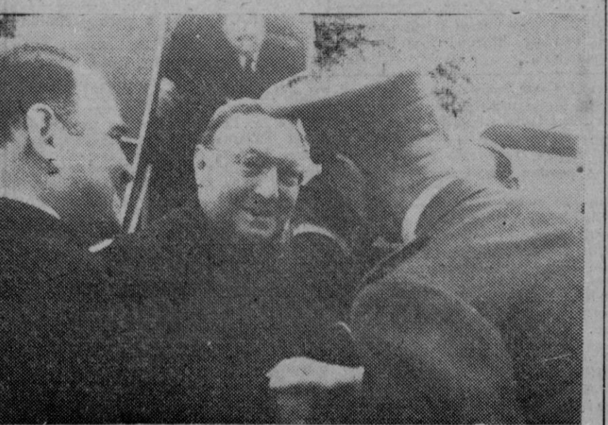
Para recibir al cardenal Caggiano, que llegó procedente de Roma, se trasladaron al aeródromo del Prat numerosas autoridades, entre las que se encontraban el doctor Modrego, un representante del ministerio de Asuntos Exteriores y otras personalidades. El ilustre purpurado argentino departió afablemente con los que acudieron a recibirle