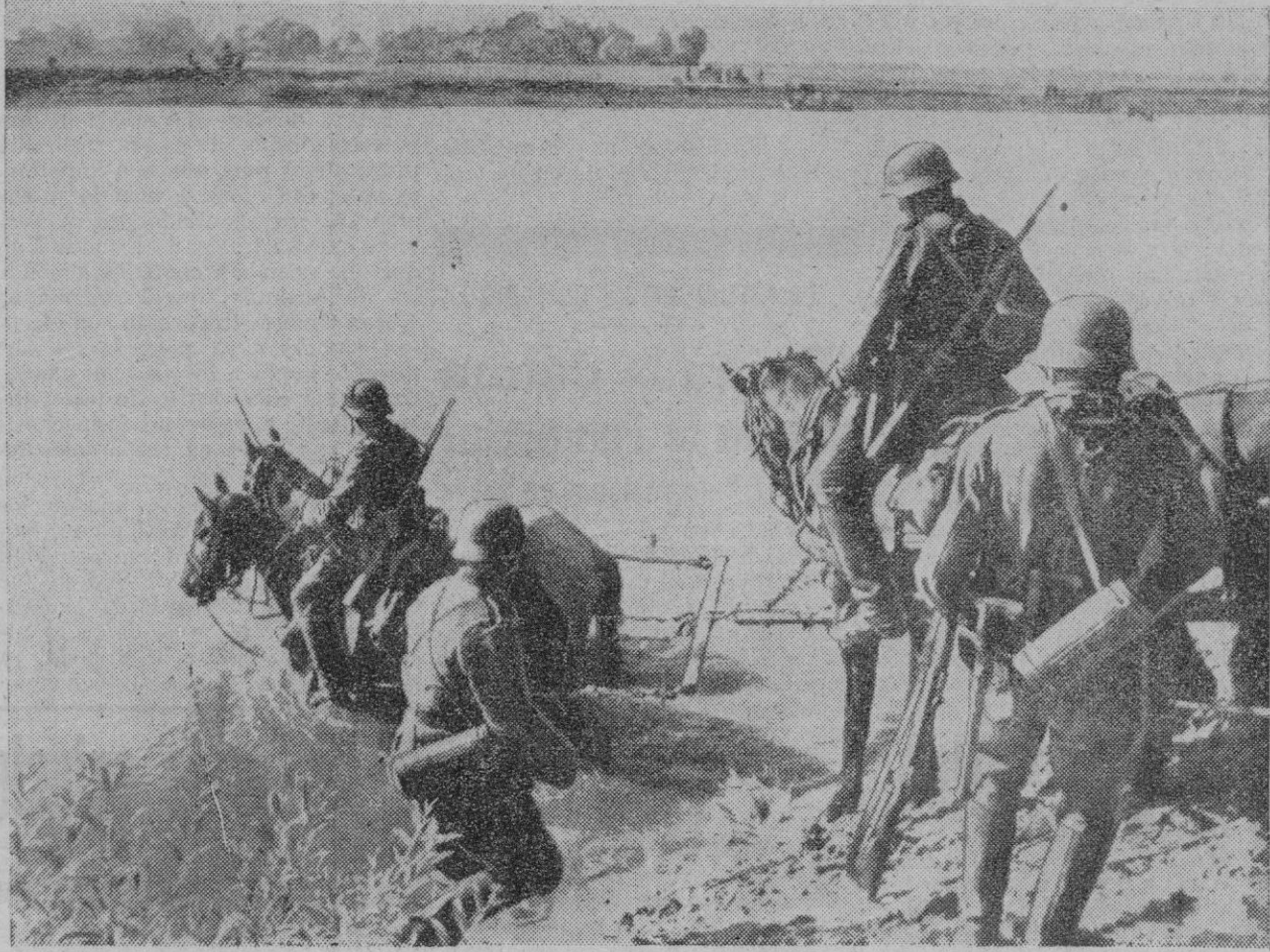
He aquí a unos soldados alemanes atravesando un río a caballo con su impedimenta. Las nubes que se observan en el fondo del grabado indican que la artillería protege, con sus disparos, la operación. El Ejército germanico atraviesa así muchas veces los ríos rusos, para ahorrarse la construcción de puentes provisionales y avanzar, de este modo, con mayor rapidez.

Otros tres barcos gravemente alcanzados por torpedos