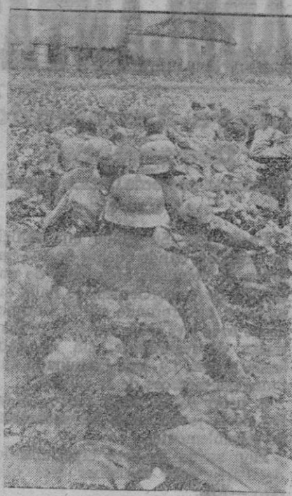
Una sección alemana de infantería llega a una aldea rusa de la que se han retirado sus defensores ante el ataque alemán. Hasta asegurarse de que no hay ningún rosa escondido, avanzan con precaución.

Por otra parte, hemos perdido dos unidades de tonelaje medio de la Marina real.—Efe.