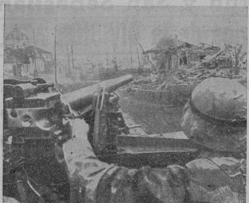
LOS PROGRESOS EN EL FRENTE ORIENTAL.—Los artilleros alemanes ven de esta manera los pueblos rusos, cuando con sus carros de asalto avanzan por regiones que antes han sido bombardeadas. El cañón del carro apunta de una forma amenazadora y está siempre dispuesto a entrar en acción.

Berlín, 14 (2 t.).—Fuerzas importantes de la aviación alemana continuaron ayer sus ataques a los puertos del mar Negro, donde los bolcheviques intentan embarcar a las divisiones que se repliegan y el material de guerra. Las operaciones se vieron coronadas por el éxito. Varios barcos mercantes, cada uno con un desplazamiento de más de 4.000 toneladas fueron gravemente averiados.