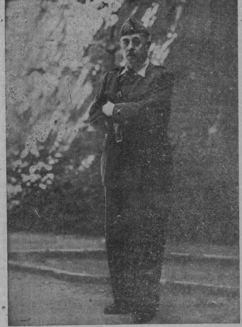
Serrador en la defensa de Segovia

Alto de los Leones, Cabeza Grande: para Segovia los dos episodios cercanos de guerra, general Serrador, general Varela: los dos salvadores de nuestras tierras segovianas. En el día de hoy—primer aniversario de uno de los hechos—los segovianos tienen un gran deber que cumplir. Y esta misión es la de dedicar una fervorosa plegaria por los caídos en esta santa guerra de independencia y el hacer, en lo más profundo de nuestro espíritu, el firme propósito de imitarlos, para la gloria de España, tanto en el heroísmo como en el martirio. Seguramente que ésta es la prueba de gratitud que más ha de agradar a nuestros dos generales salvadores. Porque ello junta la veneración por nuestros caídos y la fe indestructible que, pase lo que pase, hemos de tener en los destinos gloriosos de la España inmortal.