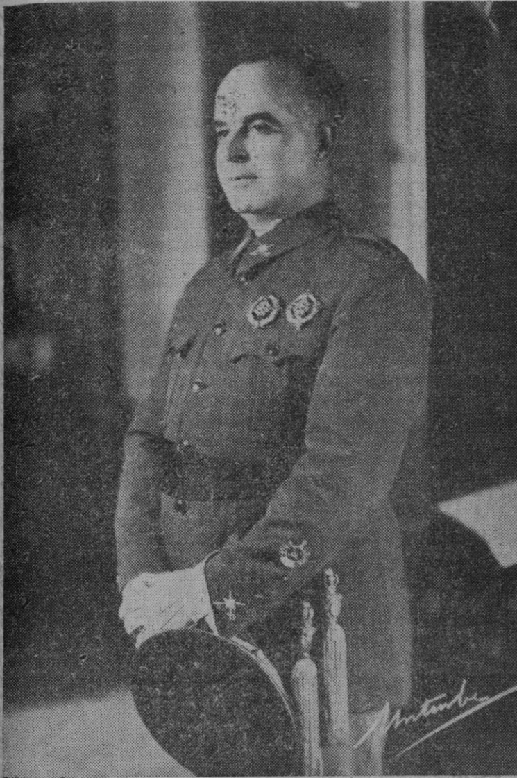
Varela en la División Avila-Segovia

Tras la acción brillantísima de defensa de nuestra línea de La Marañosa, frente a los fuertes contraataques montados por el enemigo, el General dispuso que el general Varela pasara a hacerse cargo del mando de la División del frente de Avila-Segovia.