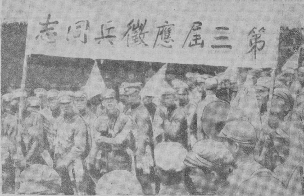
Tropas gubernamentales preparadas para marchar sobre la ciudad de Sian Fou

Shanghai, 2.—Circula el rumor de que los rebeldes comunistas han conseguido nuevamente apoderarse de la ciudad de Sian Fou, en la que se hizo fuerte el general Chan Sue Liang, sometido poco después al Gobierno de Nankin, contra el cual se había sublevado.