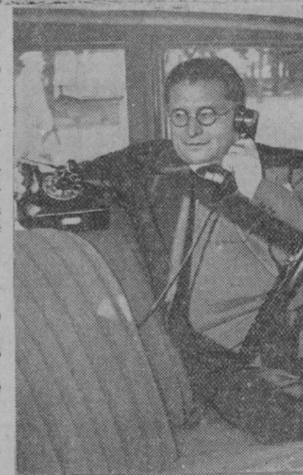
En Roma han colocado una nueva invención de radio teléfono, en el cual los transeúntes, durante el paseo, pueden comunicarse con todo el mundo

En lo que se refiere a la coalición izquierdista, las últimas noticias son que ya es un hecho—exceptuando al sindicalismo—. Por cierto que las bases socialistas han aterrorizado a los primates de las minúsculas filas republicanas burguesas que acudieron los señores Azaña, Martínez Barrio y Sánchez Román. El susto es comprensible: Nada menos que exigen—si triunfa la monstruosa amalgama—el desarme de la Guardia civil y de Asalto, socialización de la tierra, control obrero en la Banca e Industria y—según algunos—hasta la estatificación de la Prensa. Es tal el amargor que ha producido dichas bases entre los republicanos de izquierda, que piensan presentar unas contra bases que constituyan un regateo; pero, desde luego, si no logran que sean aceptadas, se hallan dispuestos a transigir en todo lo que propongan sus poderosos amigos.