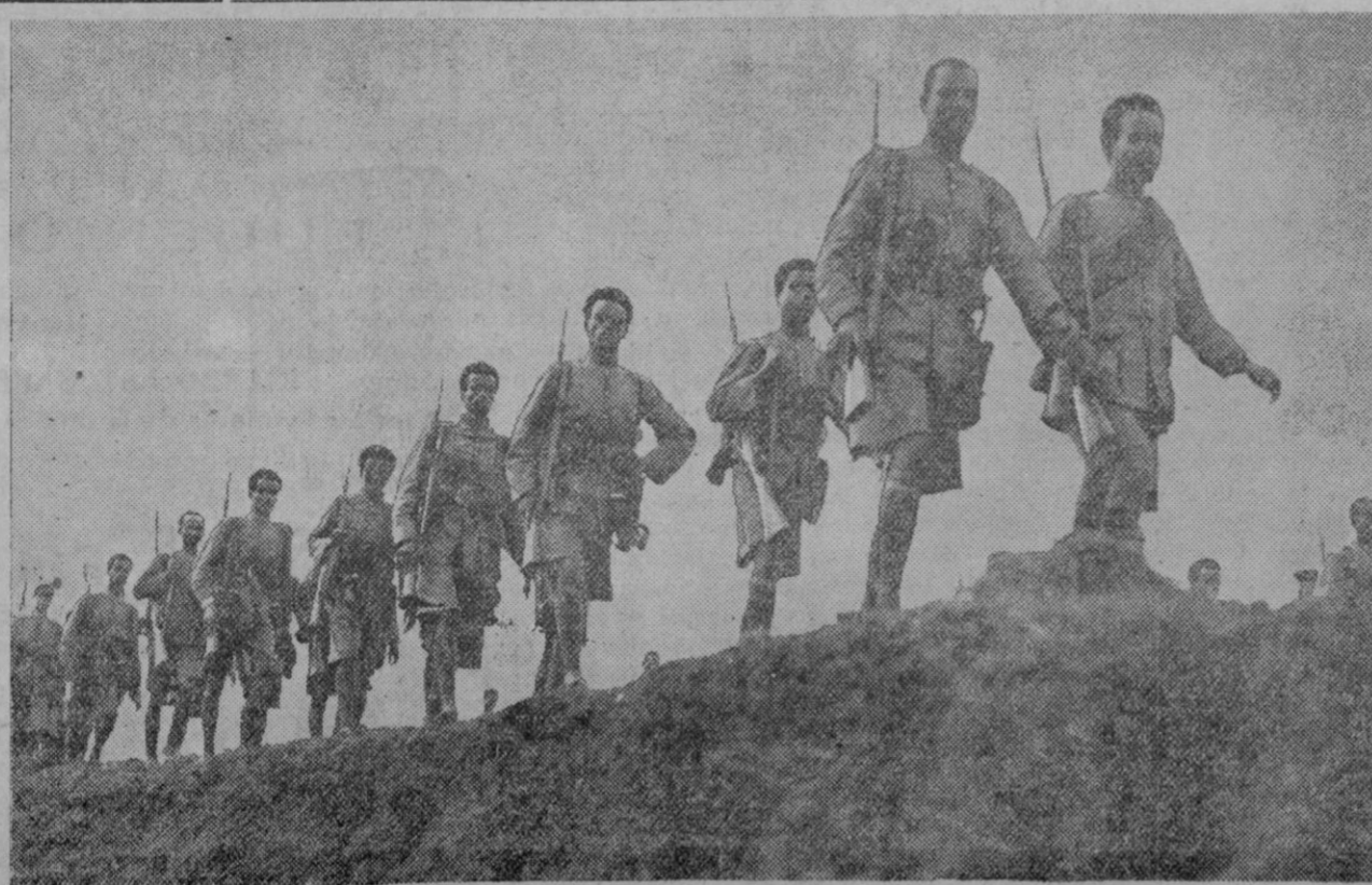
Soldados abisinios dirigiéndose al campo de batalla