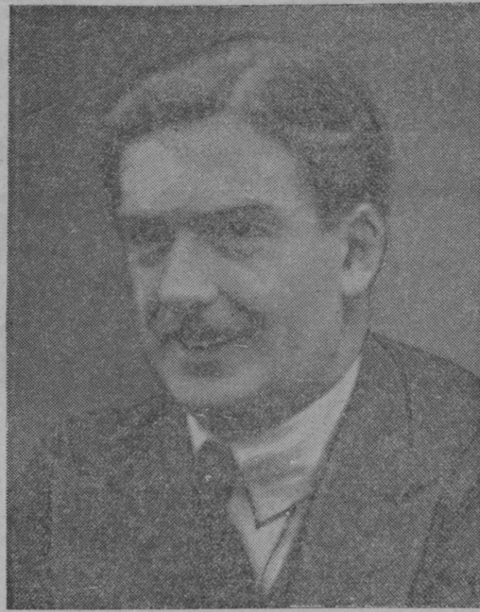
El sucesor de Samuel Hoare, Mr. Anthony Eden, ministro de Negocios Extranjeros inglés

El actual Gobierno es, además, una concesión a la revolución. Esta se produjo contra el acceso de la Ceda