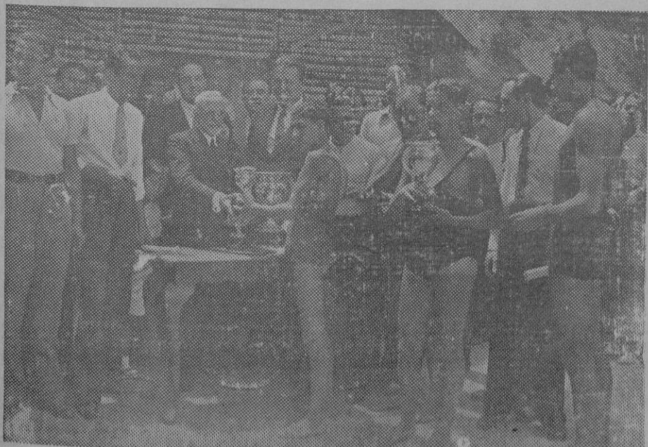
LA II VUELTA AL LAGO DE CAMPO EN MADRID.—Entrega de los premios a los vencedores.

En el quinto asalto, Ara se cansó del juego y suministró a la agilidad negra una magnífica serie al estómago y al hígado que obligaron al negro a clavar la rodilla en el ring. Ara se lanza nuevamente sobre él derribándole por segunda vez hasta